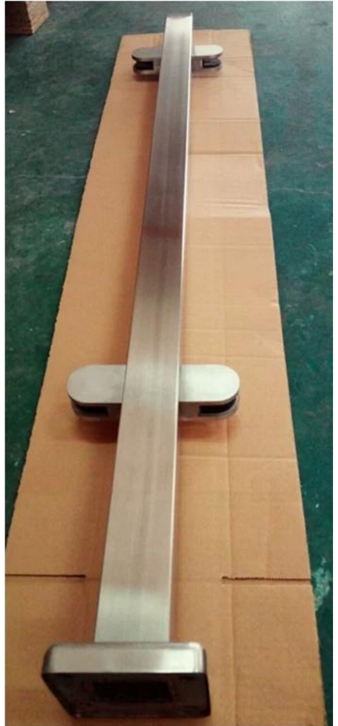
50x50 neliön pylväs ja lasihana suunnittelu portaiden ja tyhmien aita: