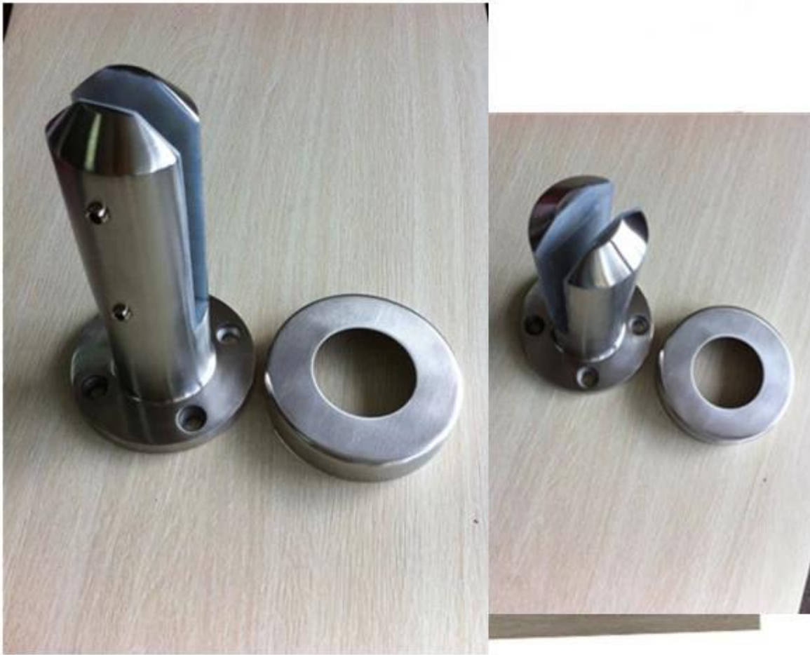
satin finish duplex2205 glass spigot