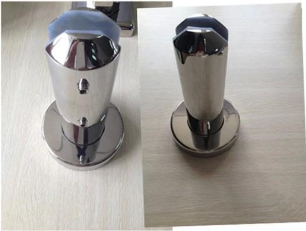
mirror finish duplex2205 glass spigot