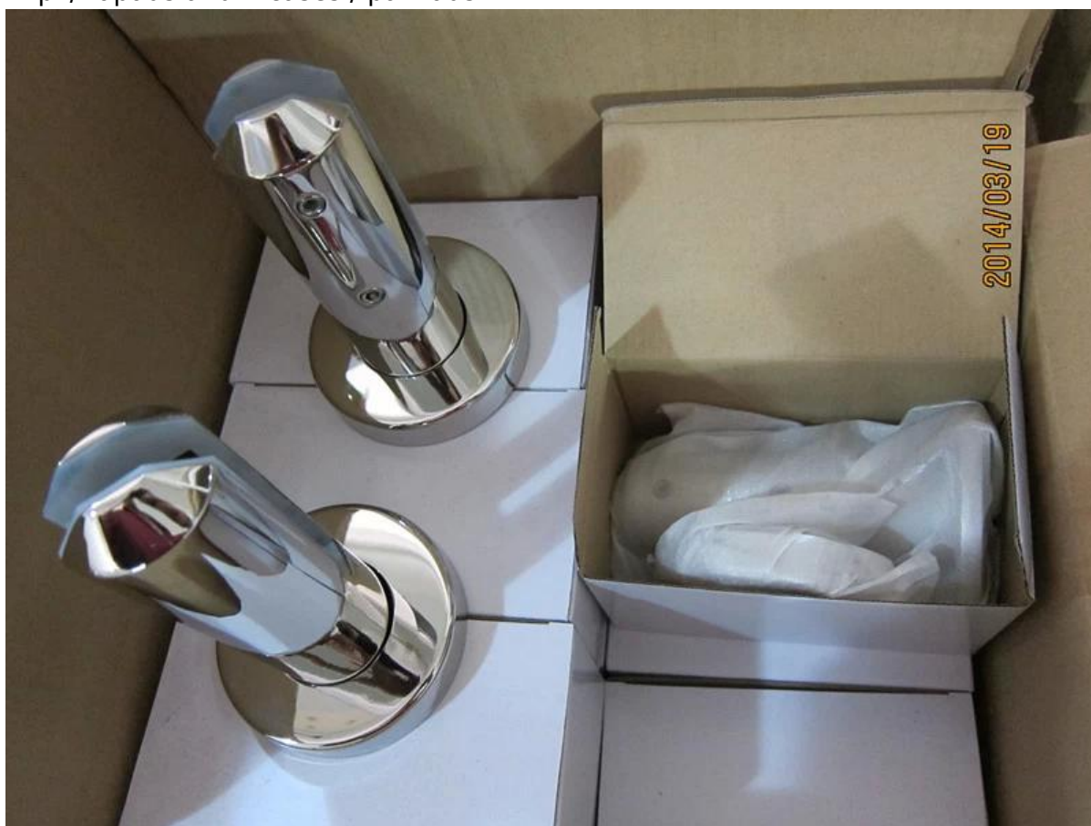
Ruostumaton teräs 316 lasi spigot saatavilla kehyksetön lasi kaide Parvekkeen suunnittelu, karkaistu lasi kaide järjestelmä allas aita