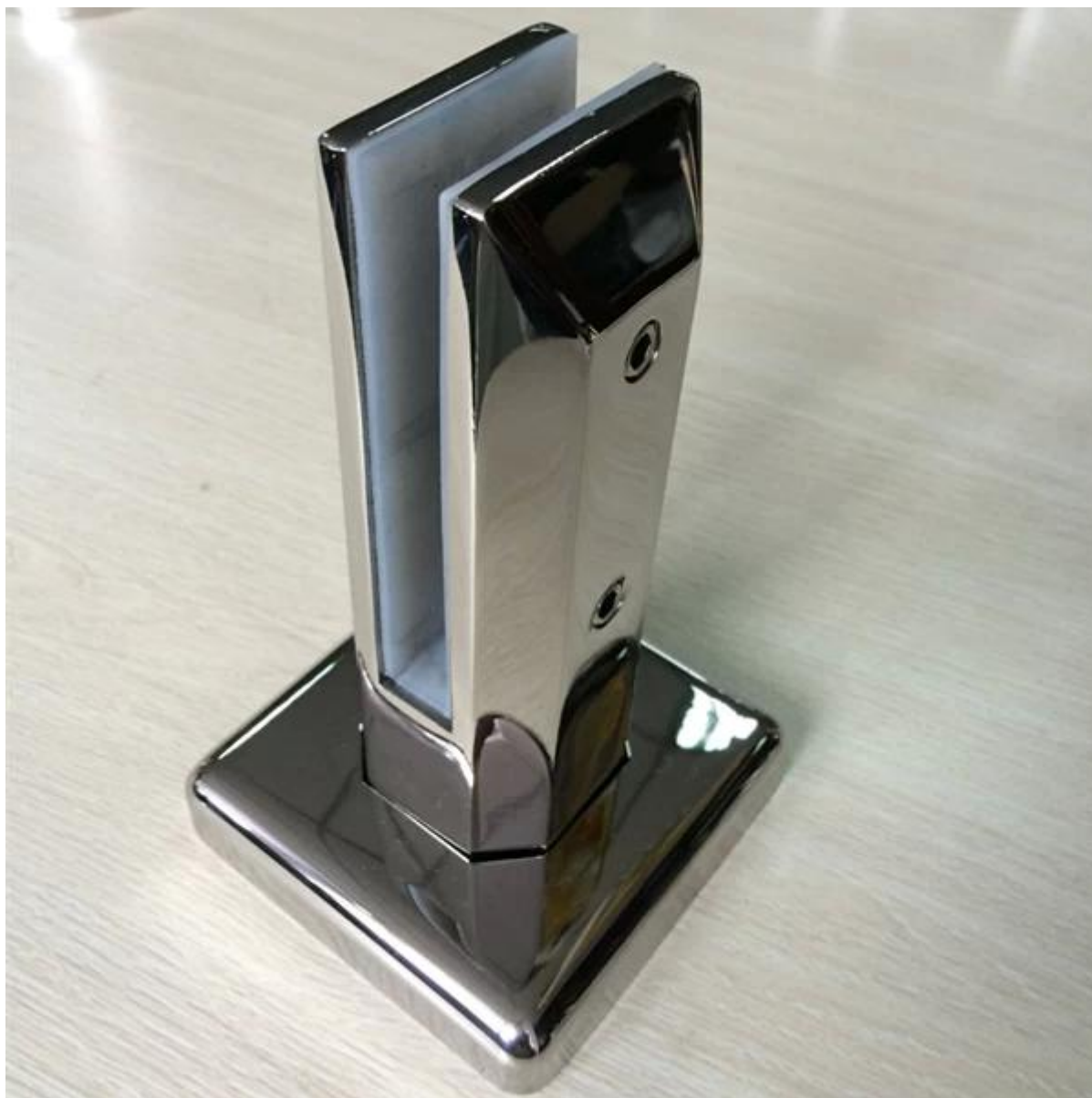
3. ruostumaton teräs kehyksetön lasikaide hana projekti kuvat,