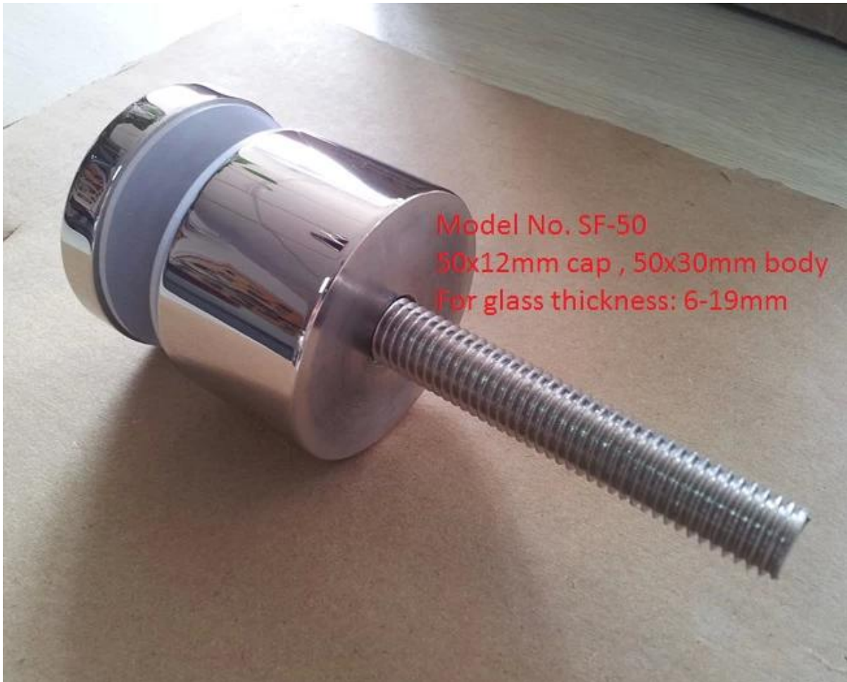
Malli No.SF-50T lasi standoff