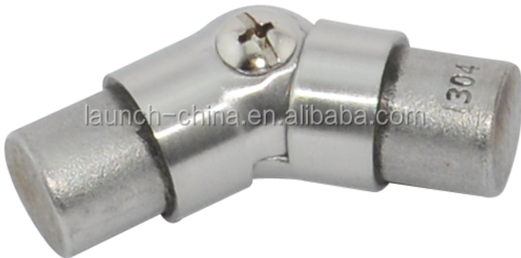
9. Malli No.E306 ruostumatonta terästä kulma putki liittimen