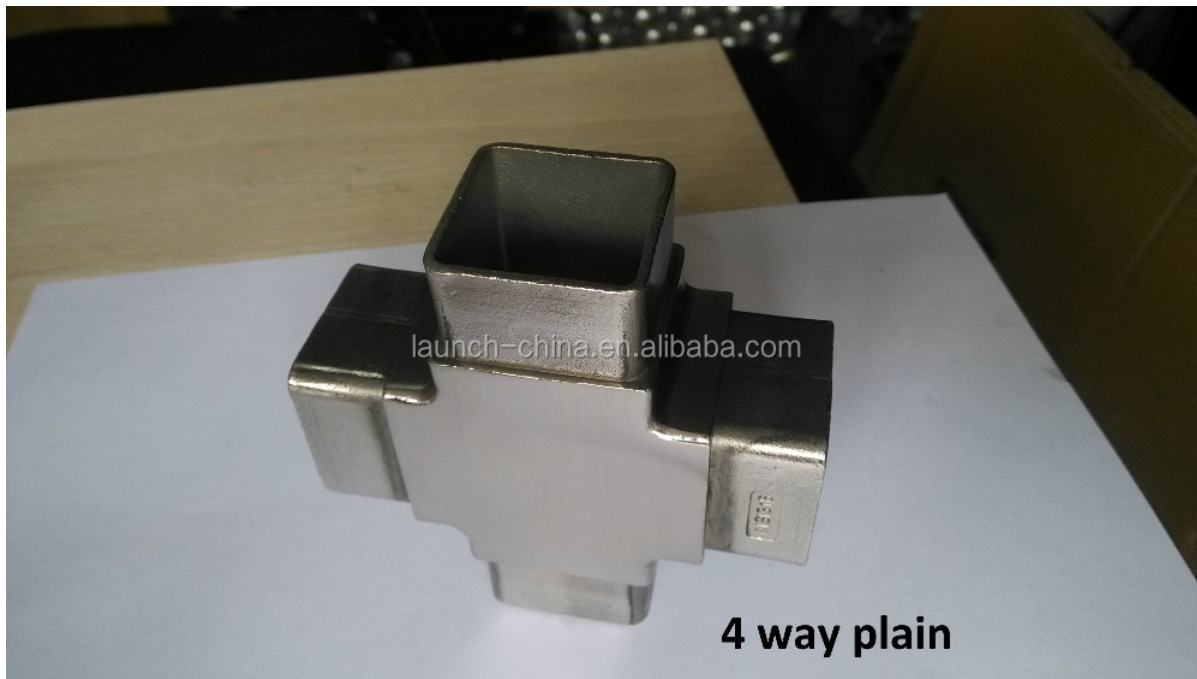
6. Malli No.E301 ruostumattomasta teräksestä liitin putken halkaisija 42.4mm / 50.8mm