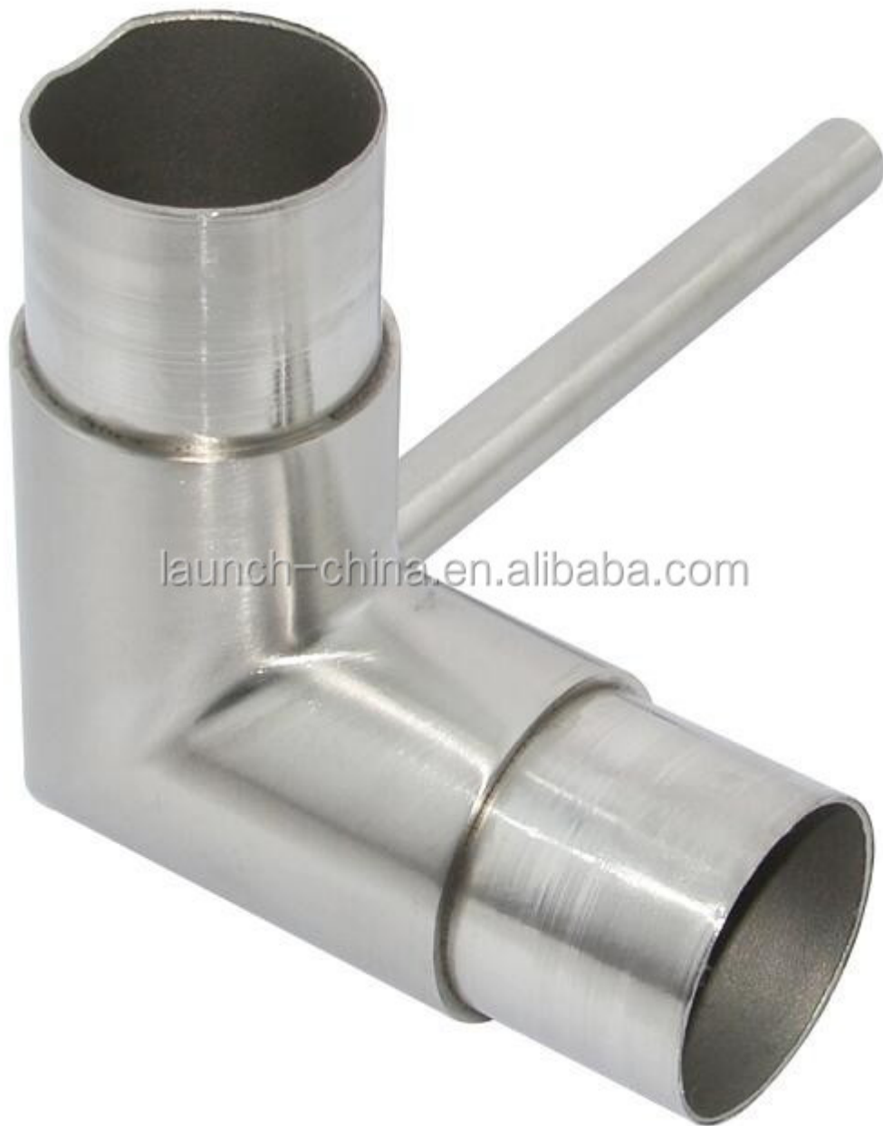
7. Malli No.E302 ruostumatonta terästä 90 asteen liitin putken halkaisija 42.4mm / 50.8mm