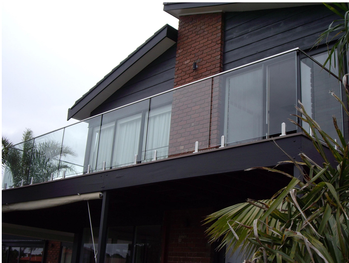
photo installation de l'acier inoxydable 316 fente supérieure main courante 21x25mm intérieur