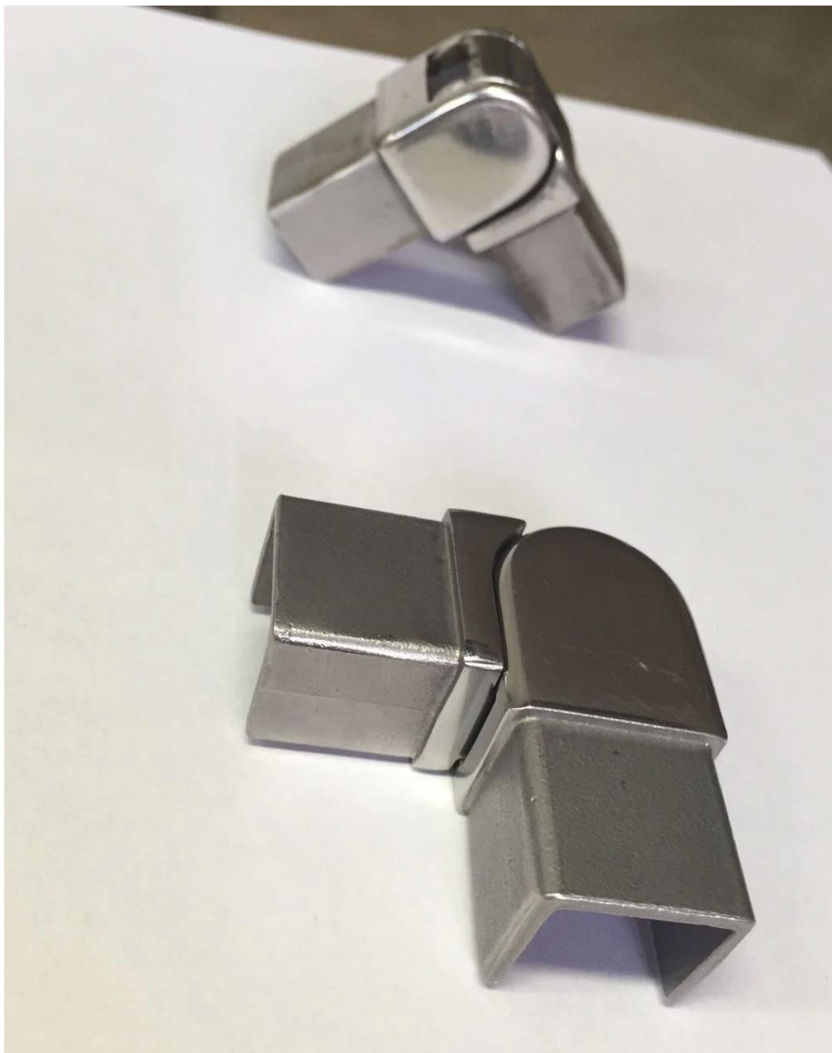
Photos d'emballage pour 316 fente supérieure en acier inoxydable main courante 21x25mm