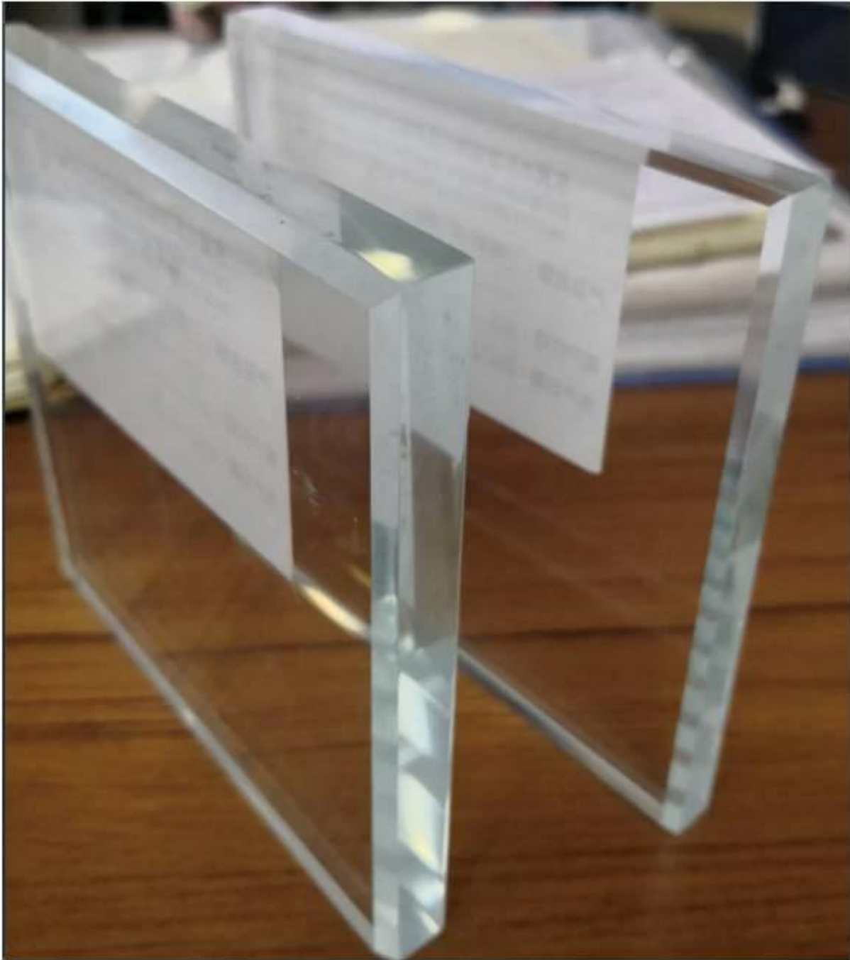
Photos du projet de garde-corps en verre -