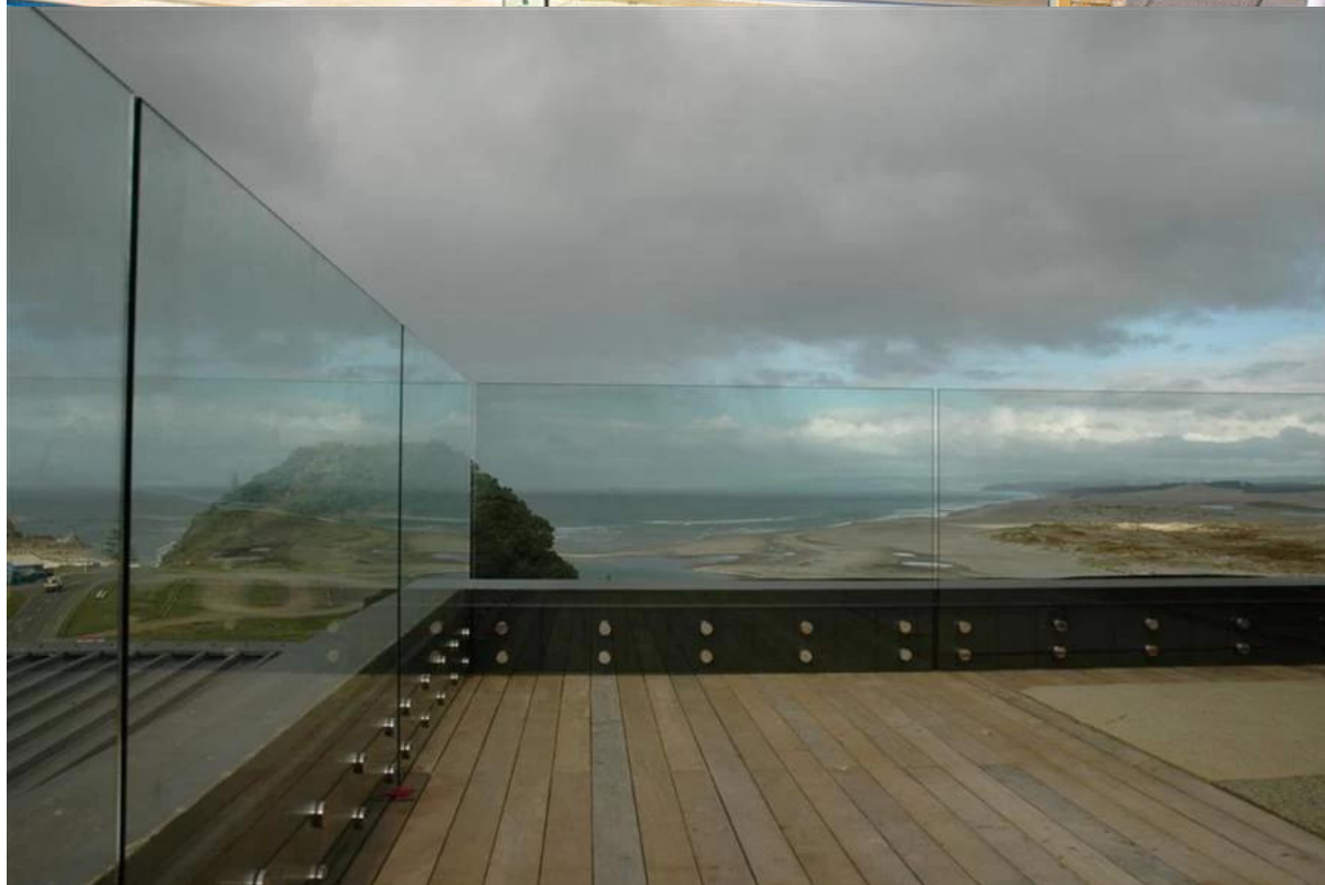
Entretoise en verre pour usage intérieur