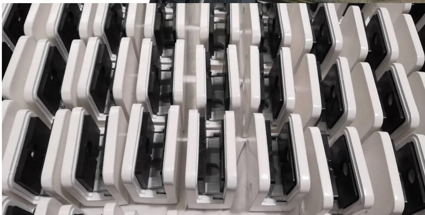
Projet de pince à verre