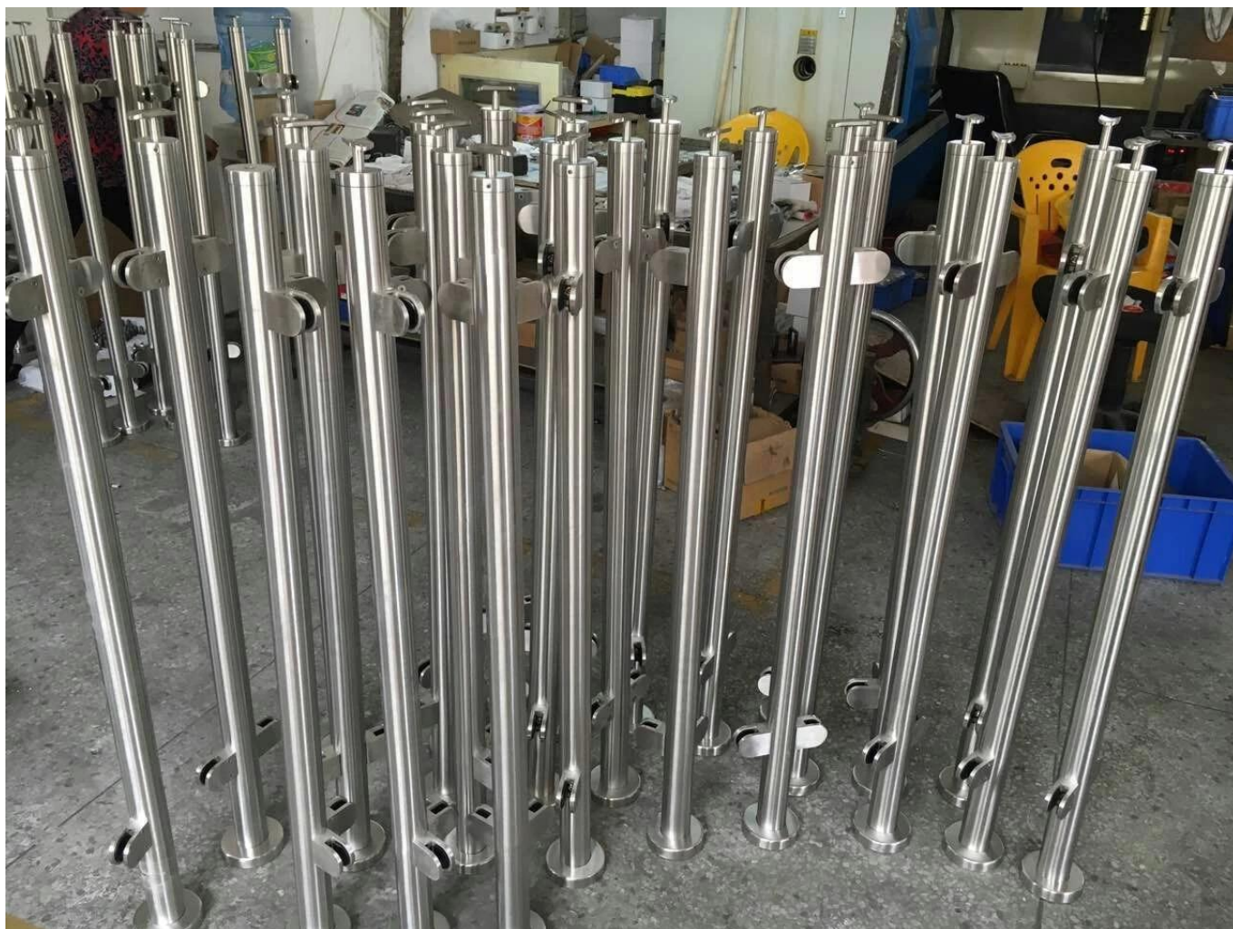
Pincas à verre de main courante: