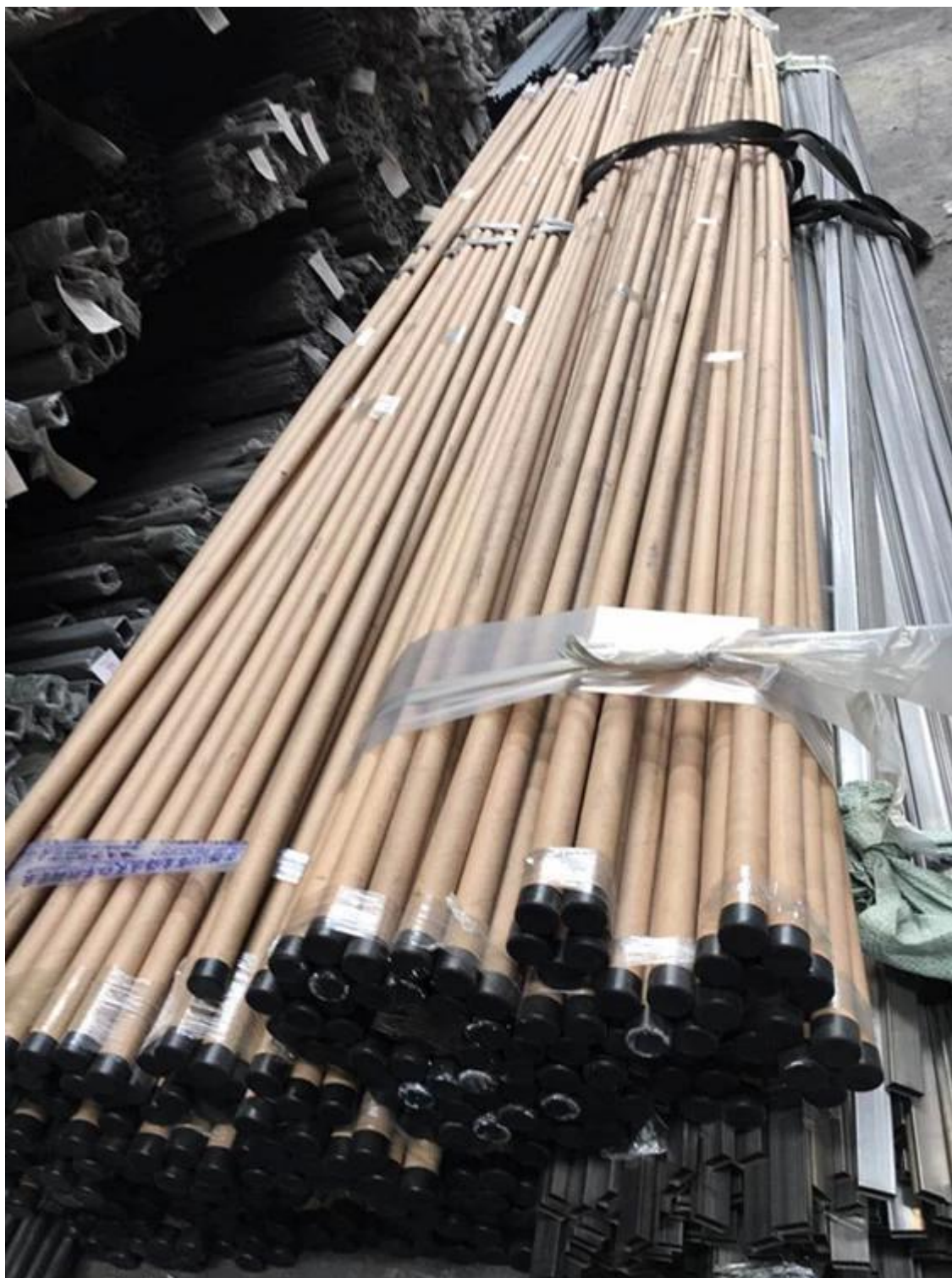
Armature en métal (100 pièces en un seul cadre métallique)