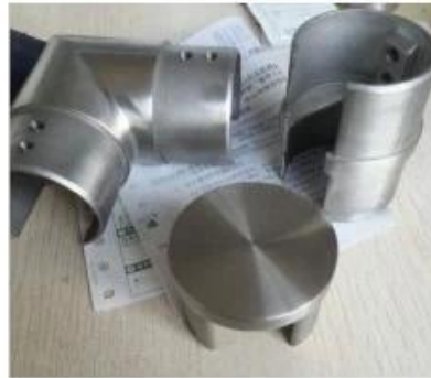
accessories for \phi 50.8mm tube