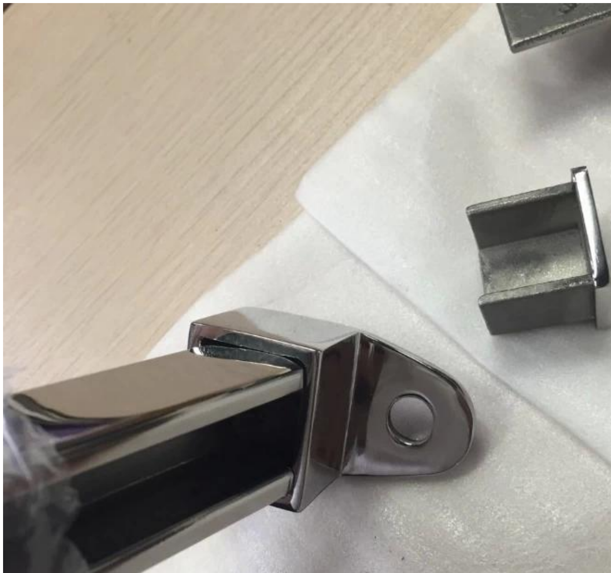
Ajustable H orizontal et v erticale Connecteurs