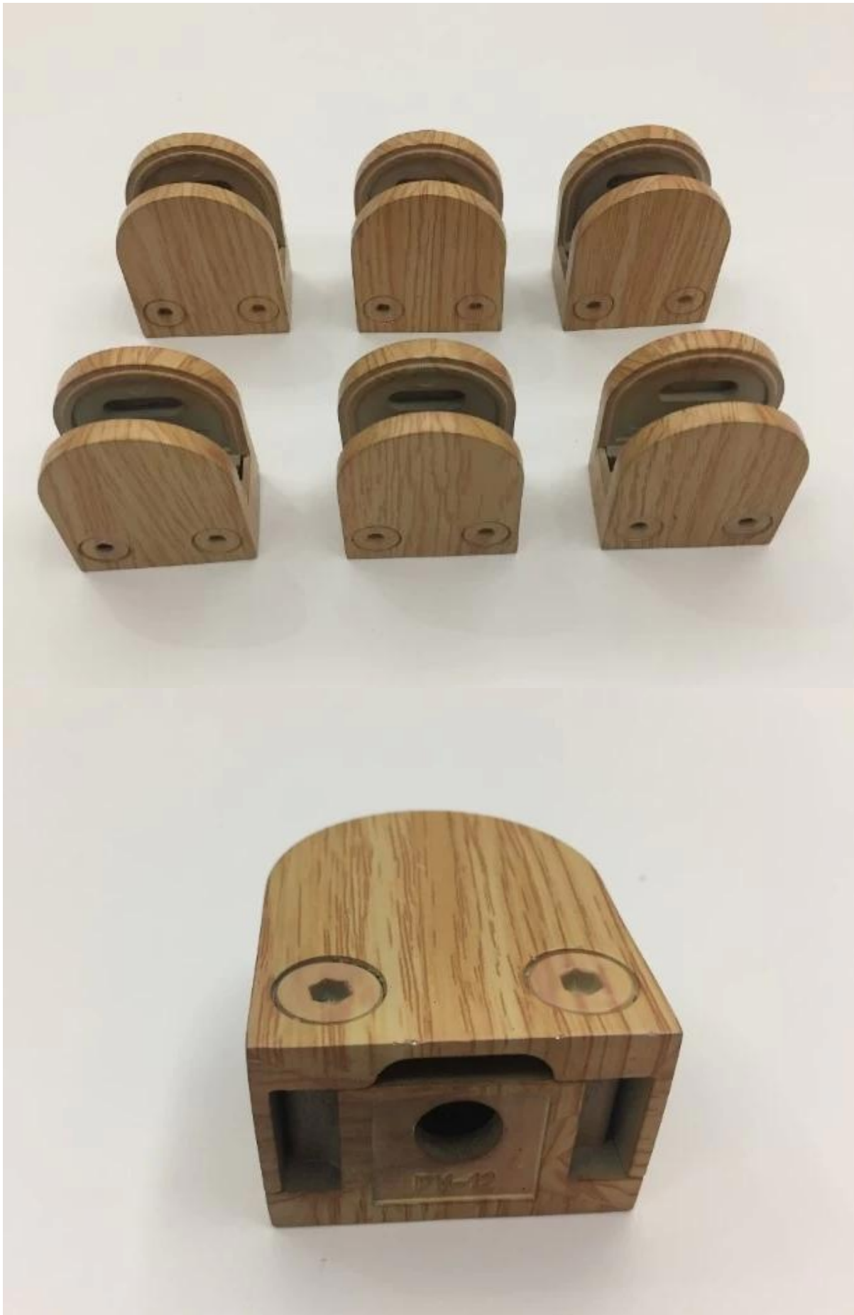
Projet de pince à verre