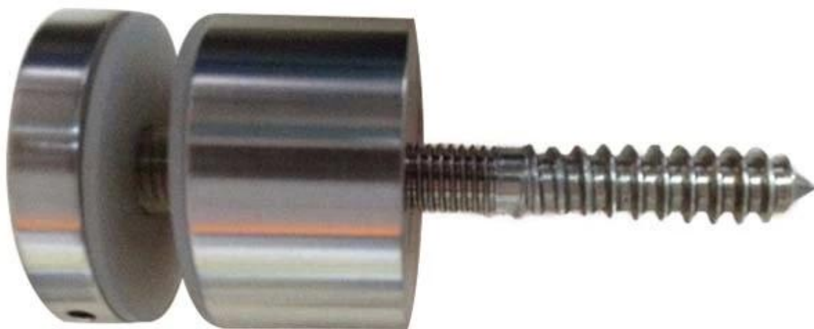
Emballage de verre support picots.