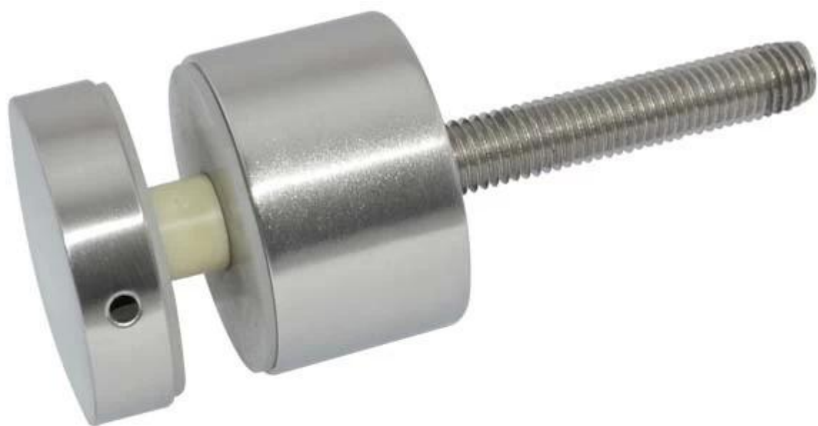
photo de verre cadre bois picots