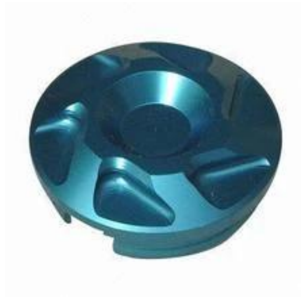
pièces d'usinage cnc en acier inoxydable