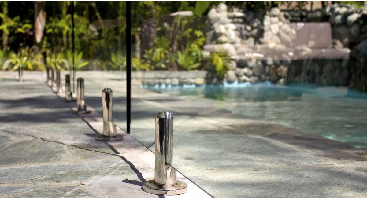
Verre sans cadre garde-corps du pont: