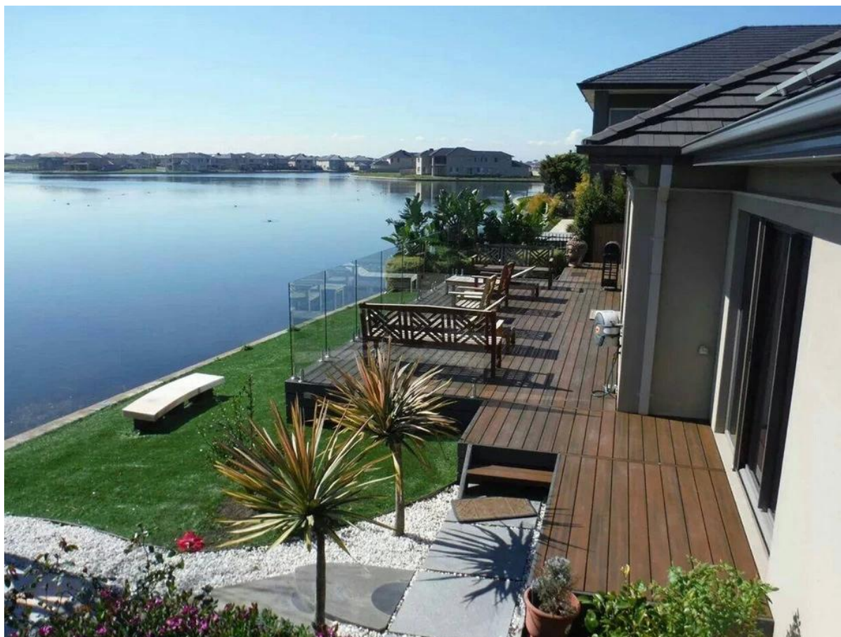
Clôtures de piscine de verre sans cadre: