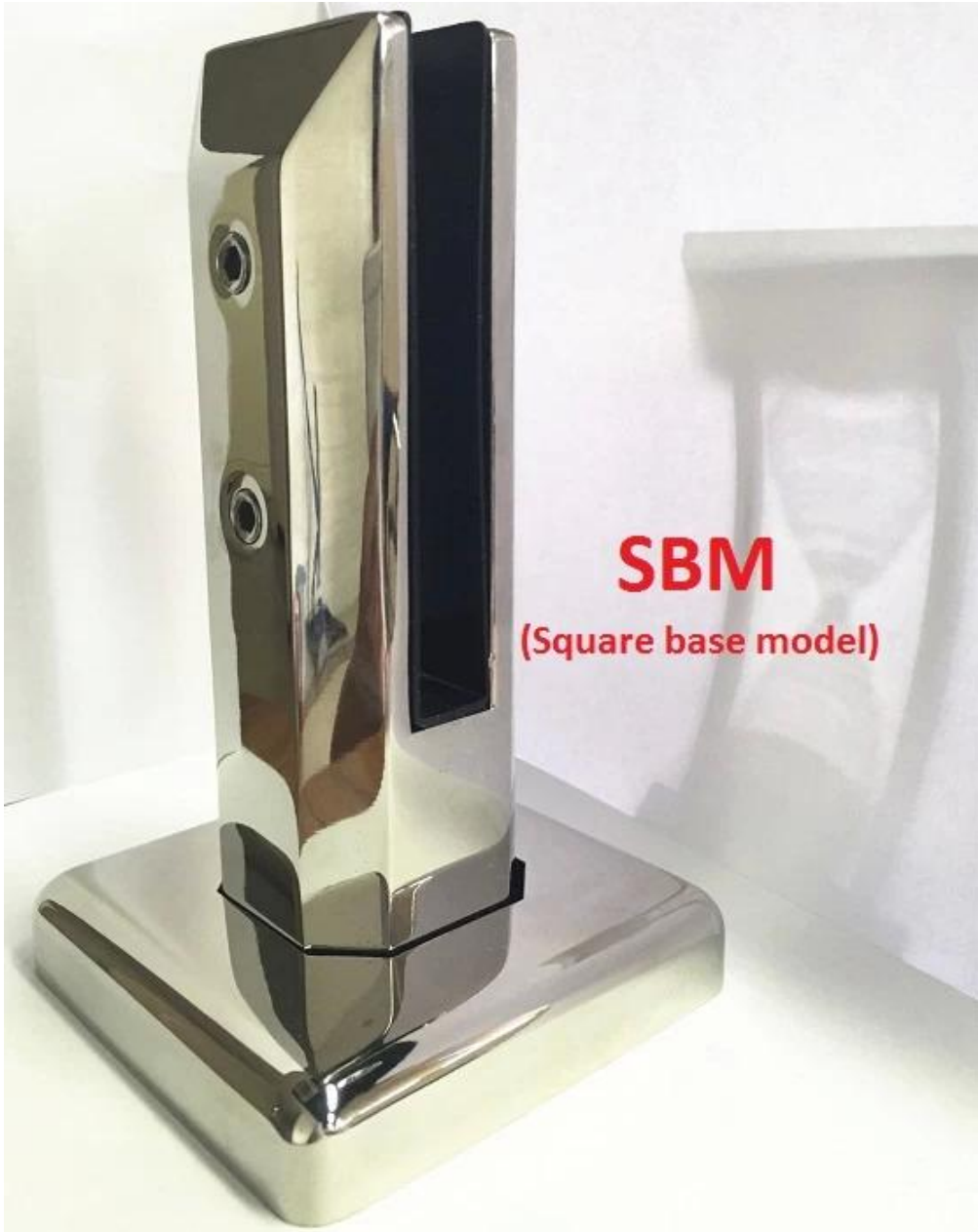
SBM (Square base model)