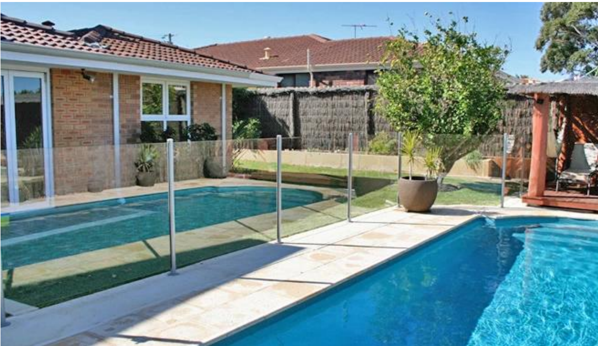
3). Montage latéral forme carrée en aluminium après: