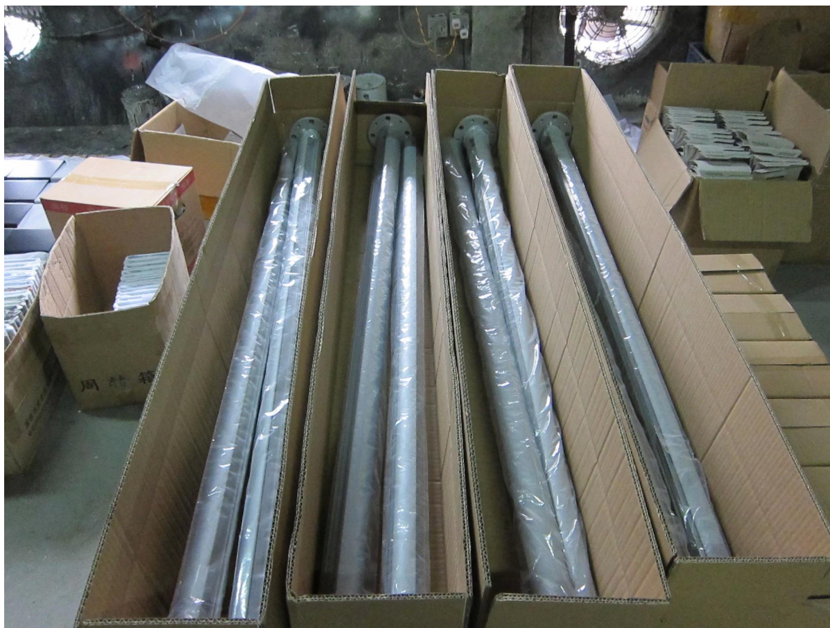
main courante en aluminium,