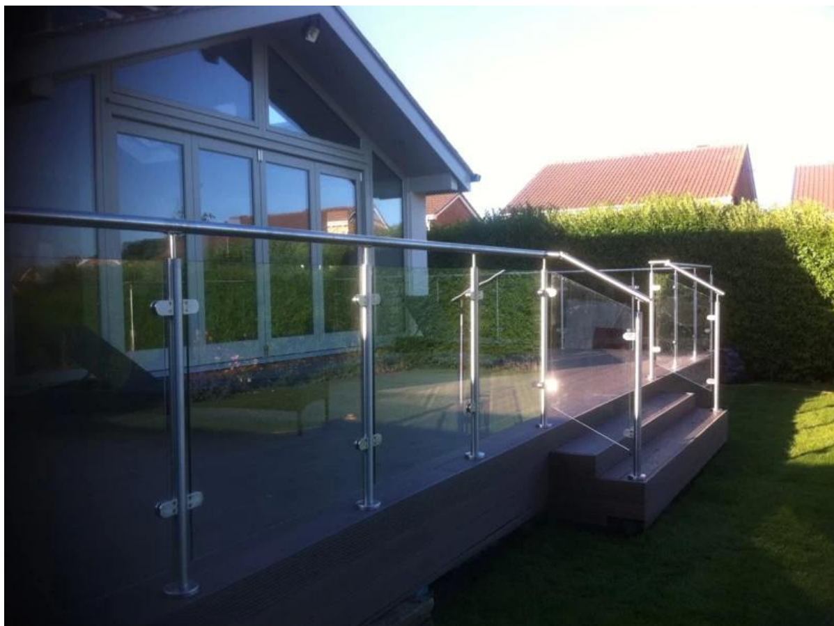
2. Spigot conception de garde-corps sans cadre: javascript: void (0); /* 1464400047103 */