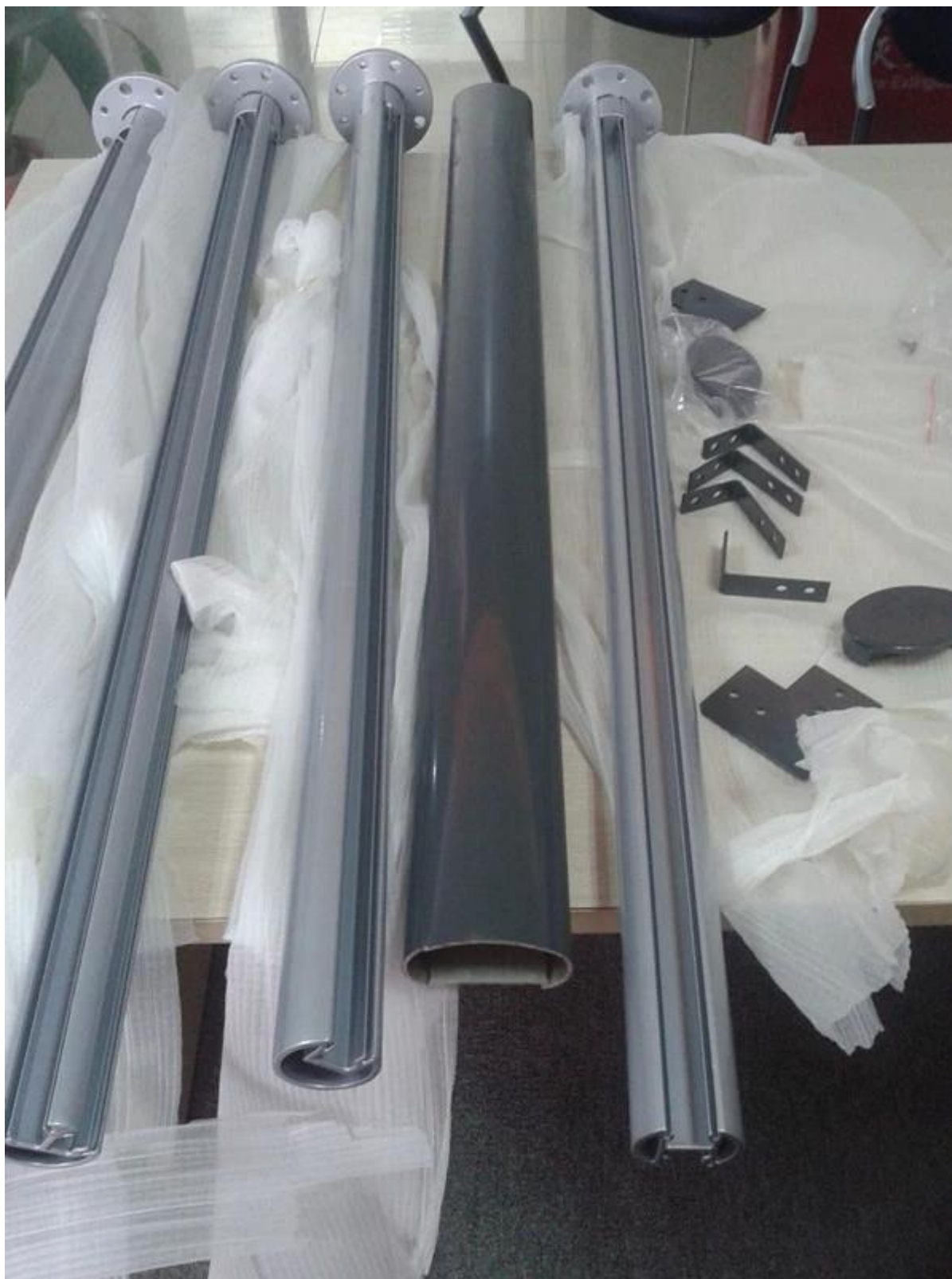
4. revêtement en poudre 6063 T5 profilé en aluminium pour garde-corps en verre: