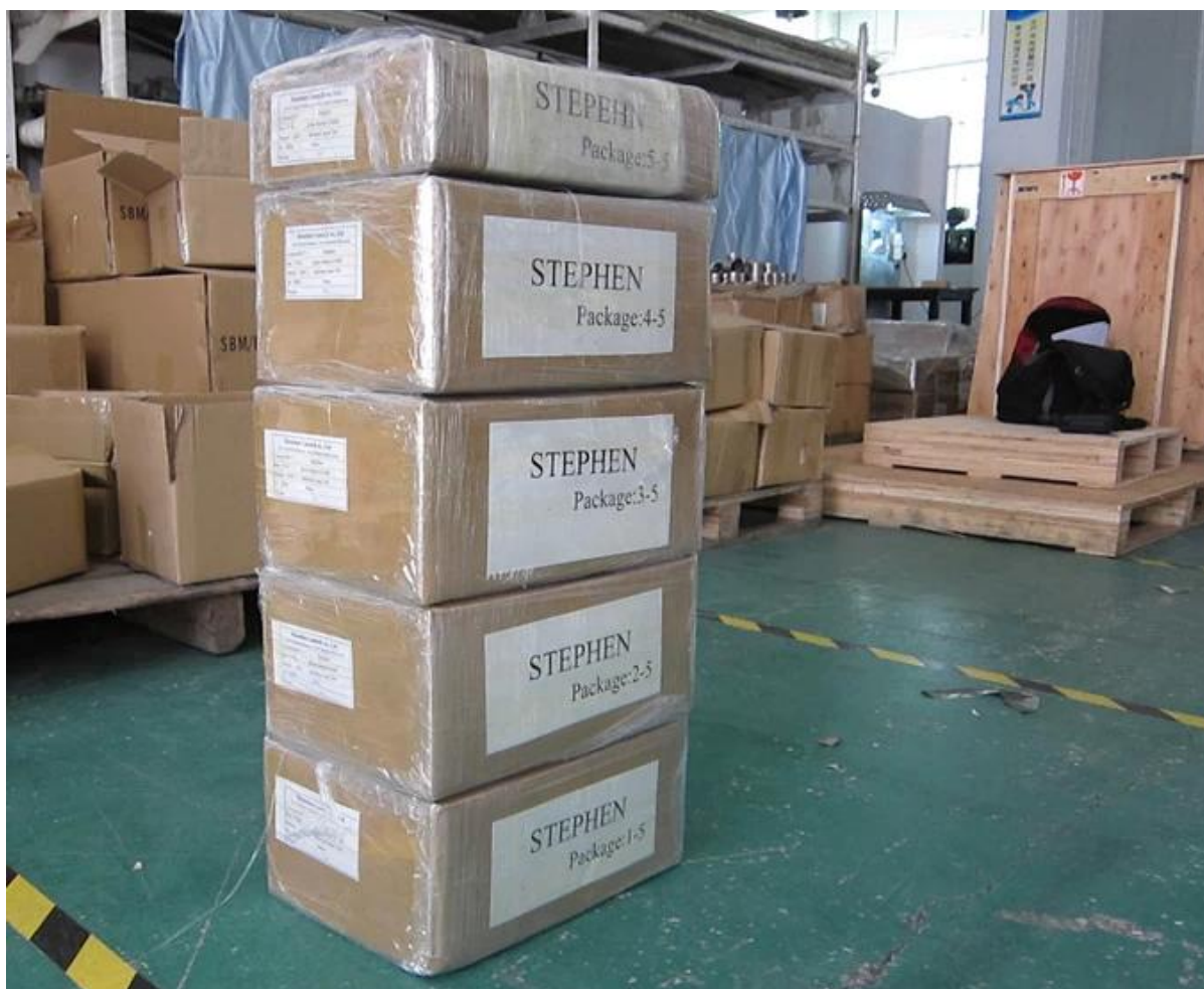
Photos de pinces à verre en acier inoxydable brossé