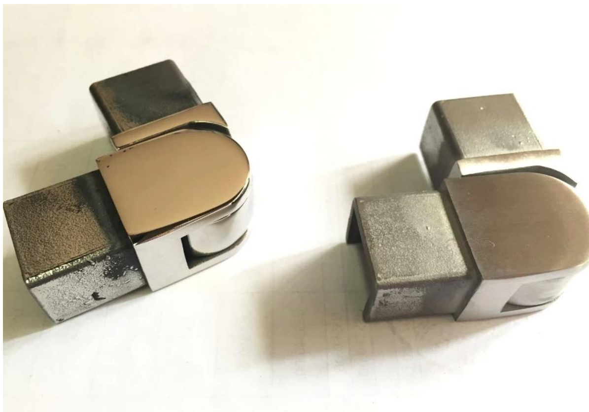
3. Photos d'emballage pour 20x25mm carré U canal main courante tube inox 316L