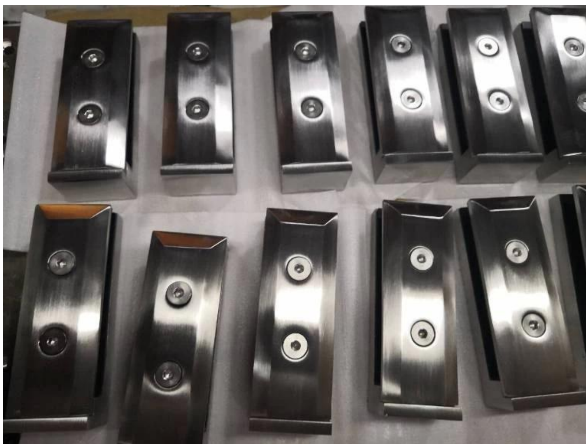
Photos du projet de tourillon en verre pour montage sur fascia -