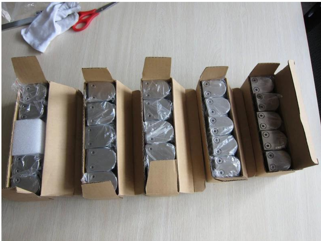
Installation de pincés à verre -