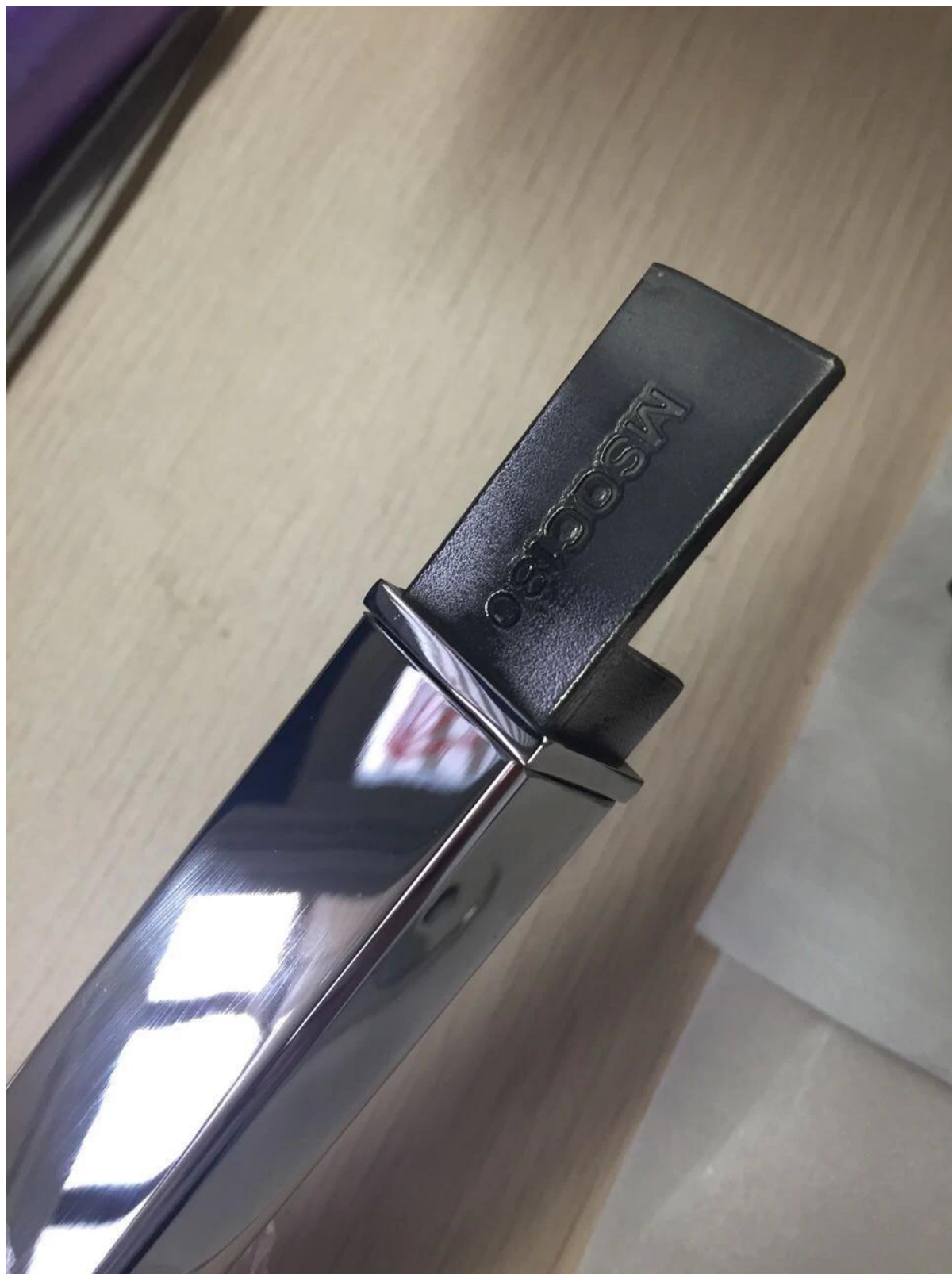
Support mural à main courante pour Main courante en acier inoxydable rainure