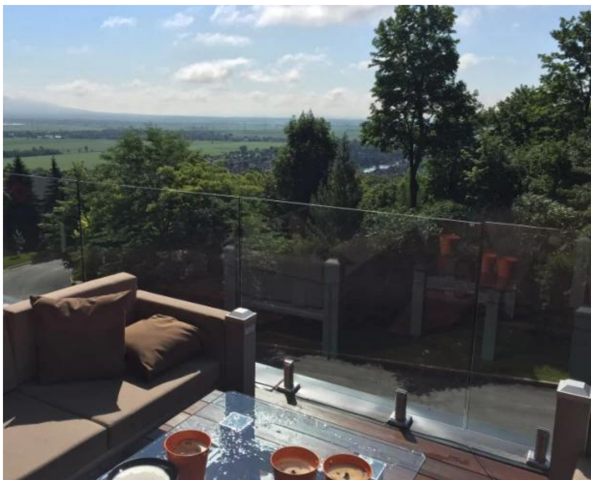
Shenzhen Launch Co., Ltd est une fabrication professionnelle avec la conception, la production et la vente de matériel en acier inoxydable, raccords de rampes de verre,