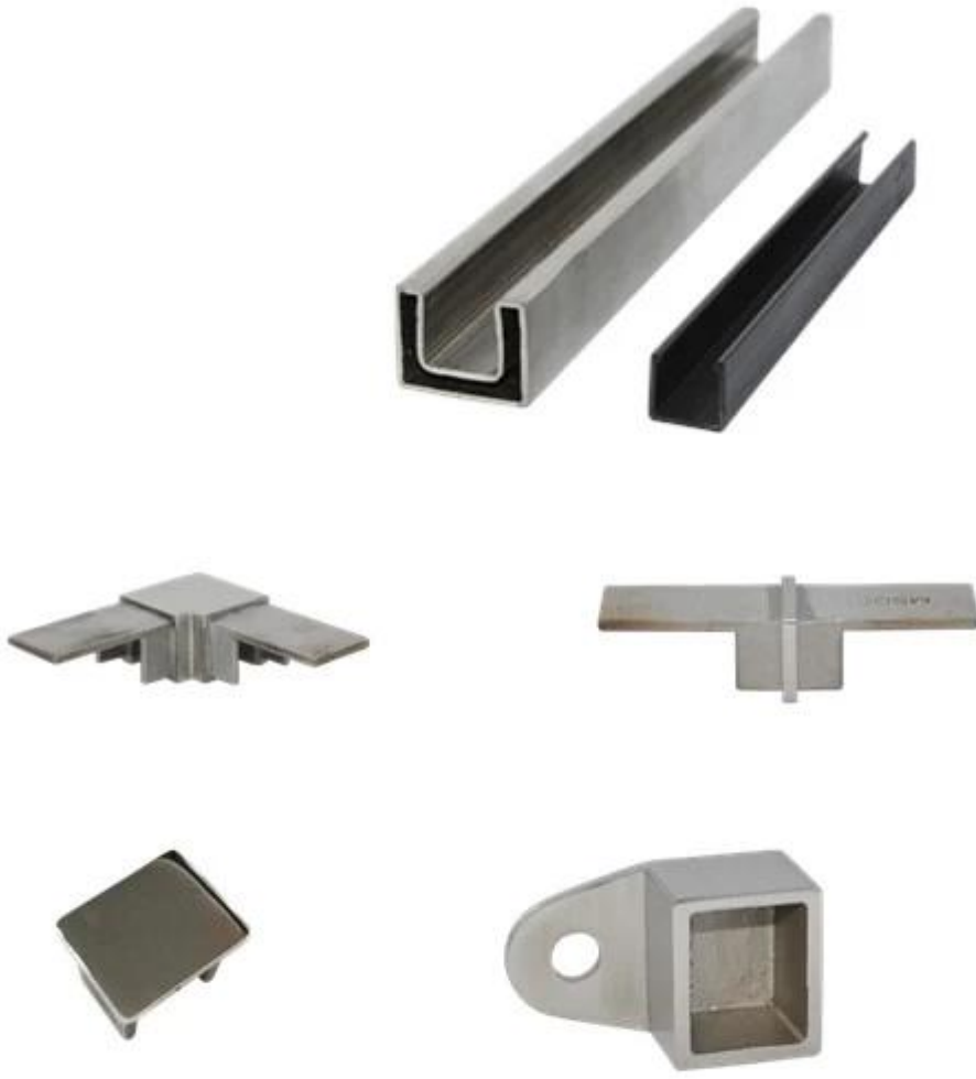
Square slot handrail series