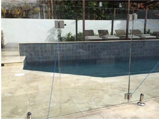
G-G2 GLASS HINGE