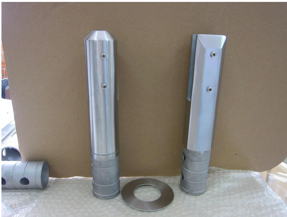
3. Πυρήνας τρυπάνι & amp? πλάκα βάσης 4 τύπους κάνουλες javascript: void (0)? /* 1467362864636 */