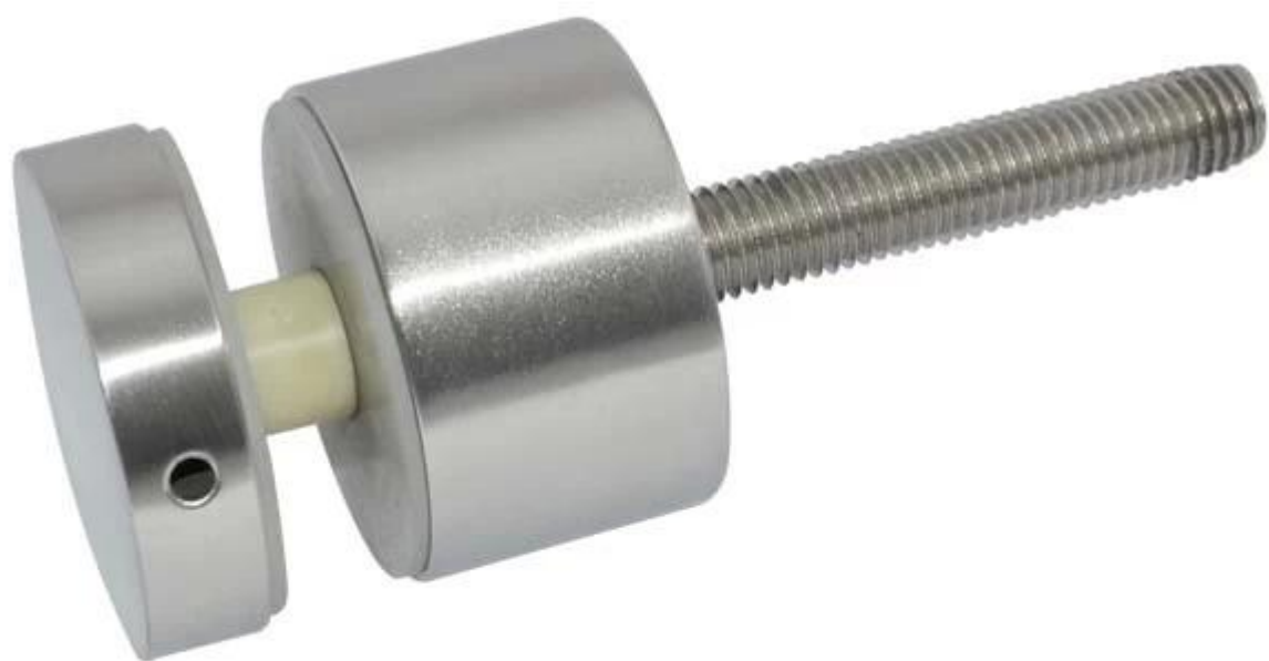
Foto di StandOff mensola staffa di vetro montaggio legno