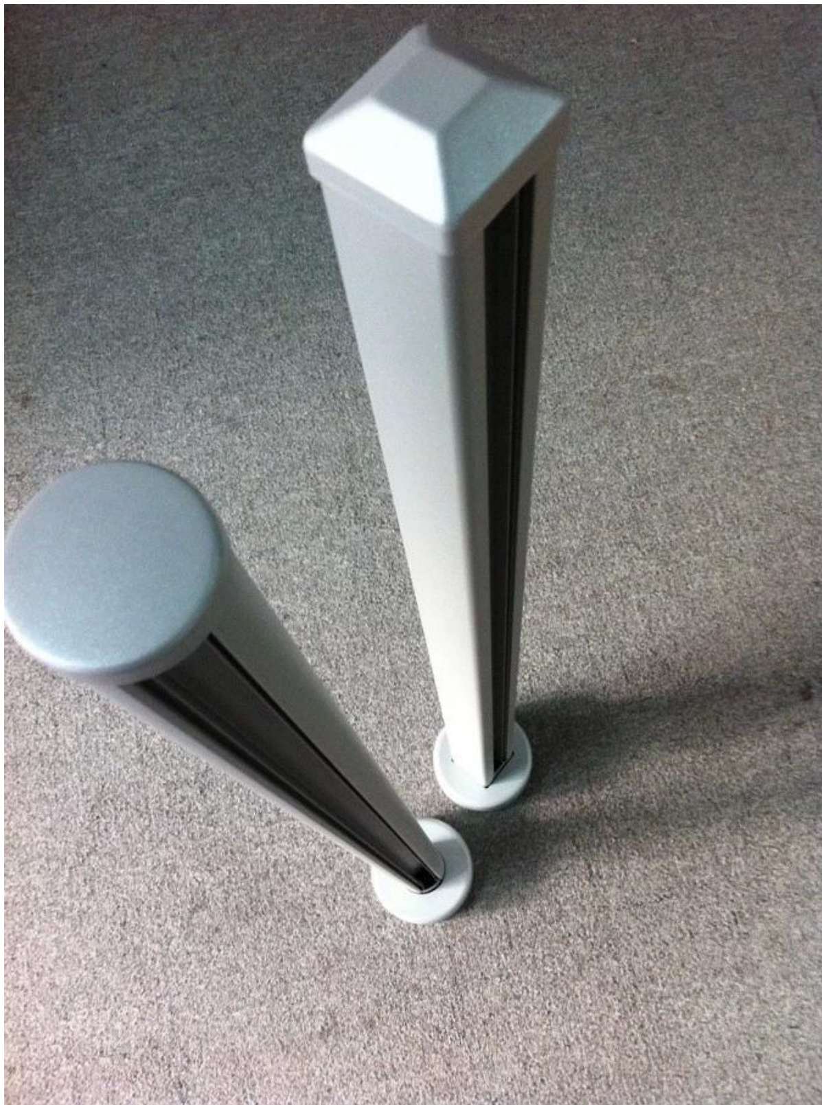
Pilastro tondo con gomma/canale a fessura, con spessore di 3mm;