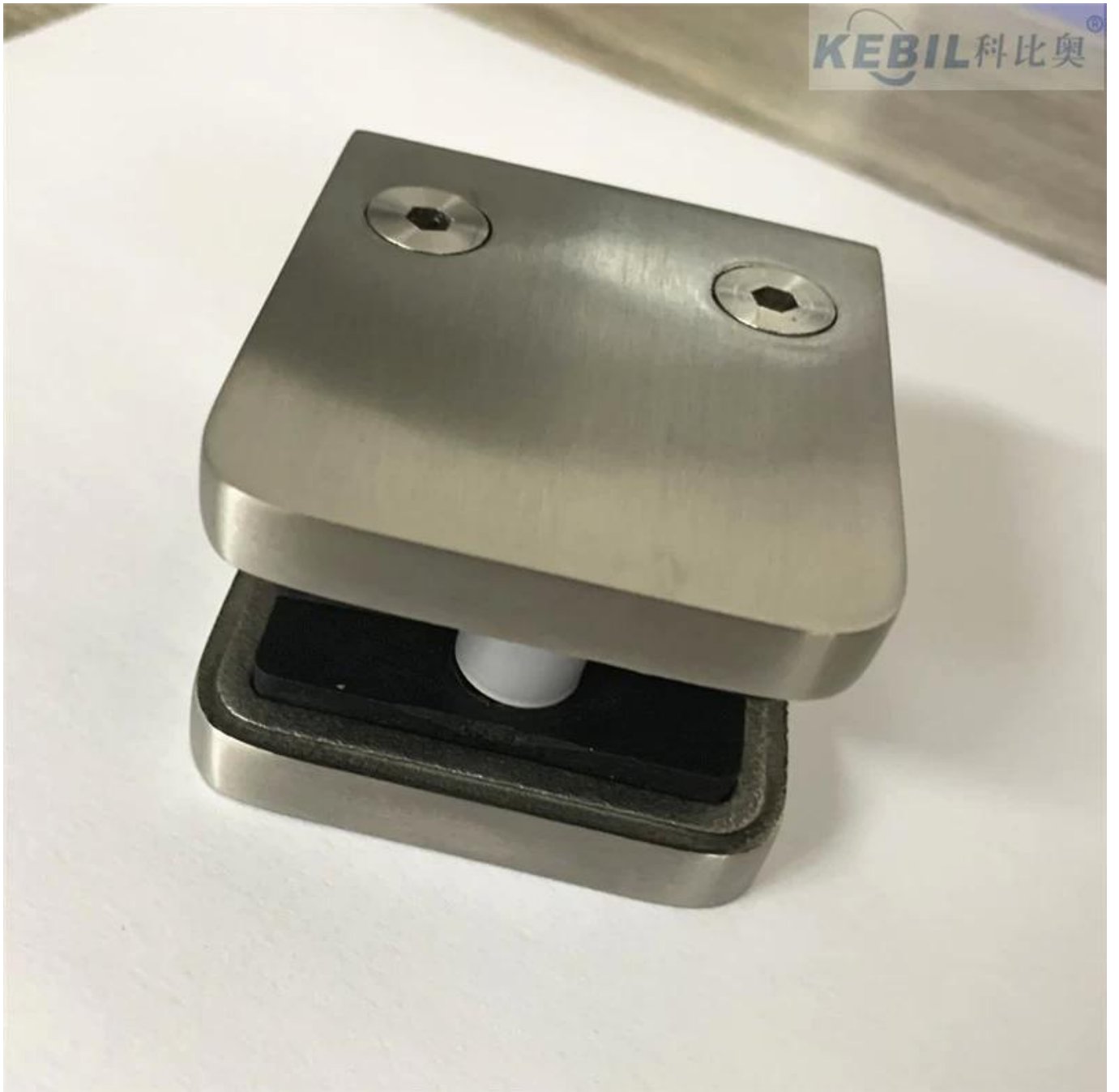
Morsetto di vetro montato su pali in acciaio inossidabile