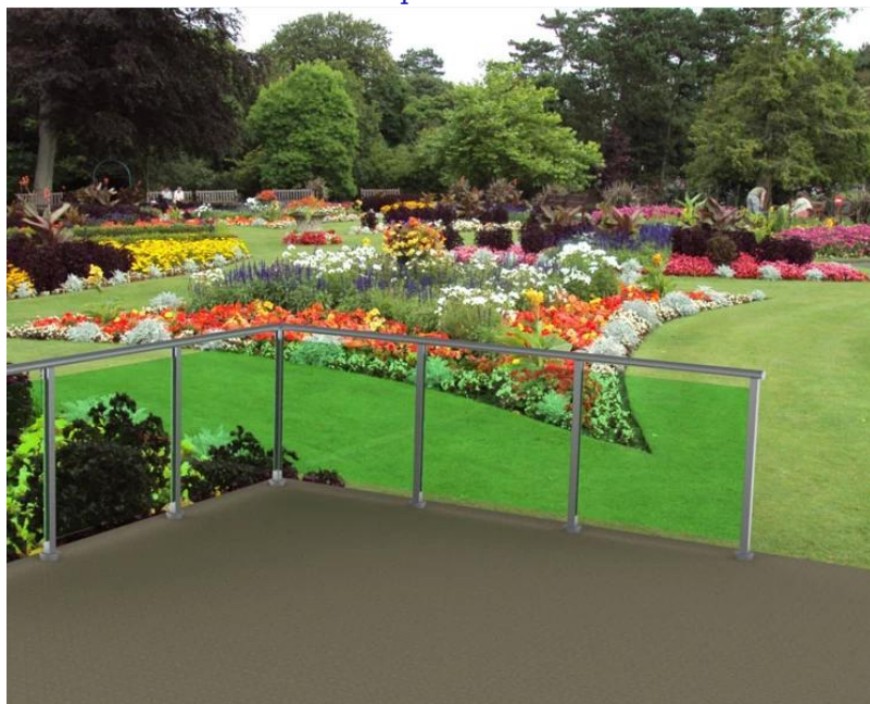
Colonnina in alluminio per piscina recinzione ringhiera in vetro