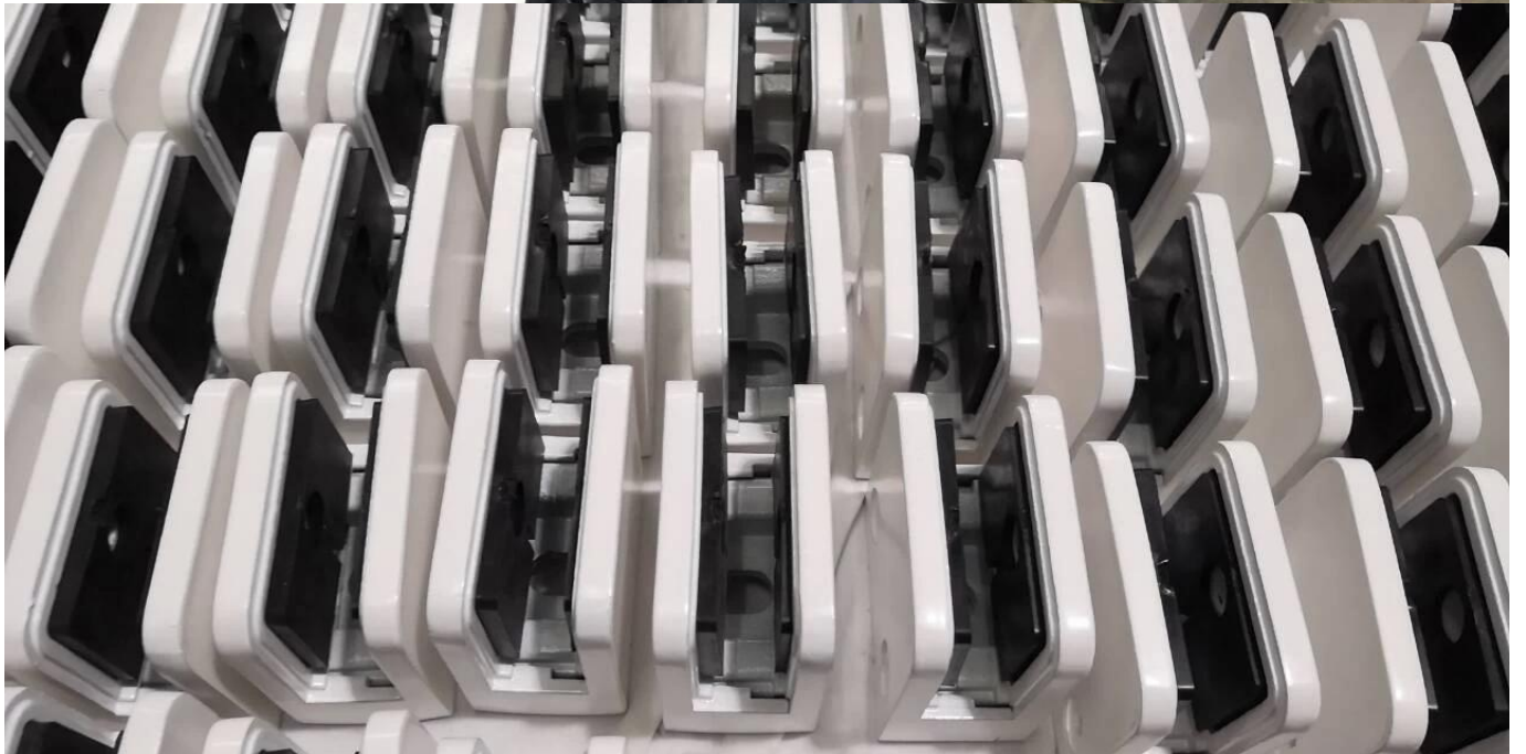
Progetto Glass Clamp