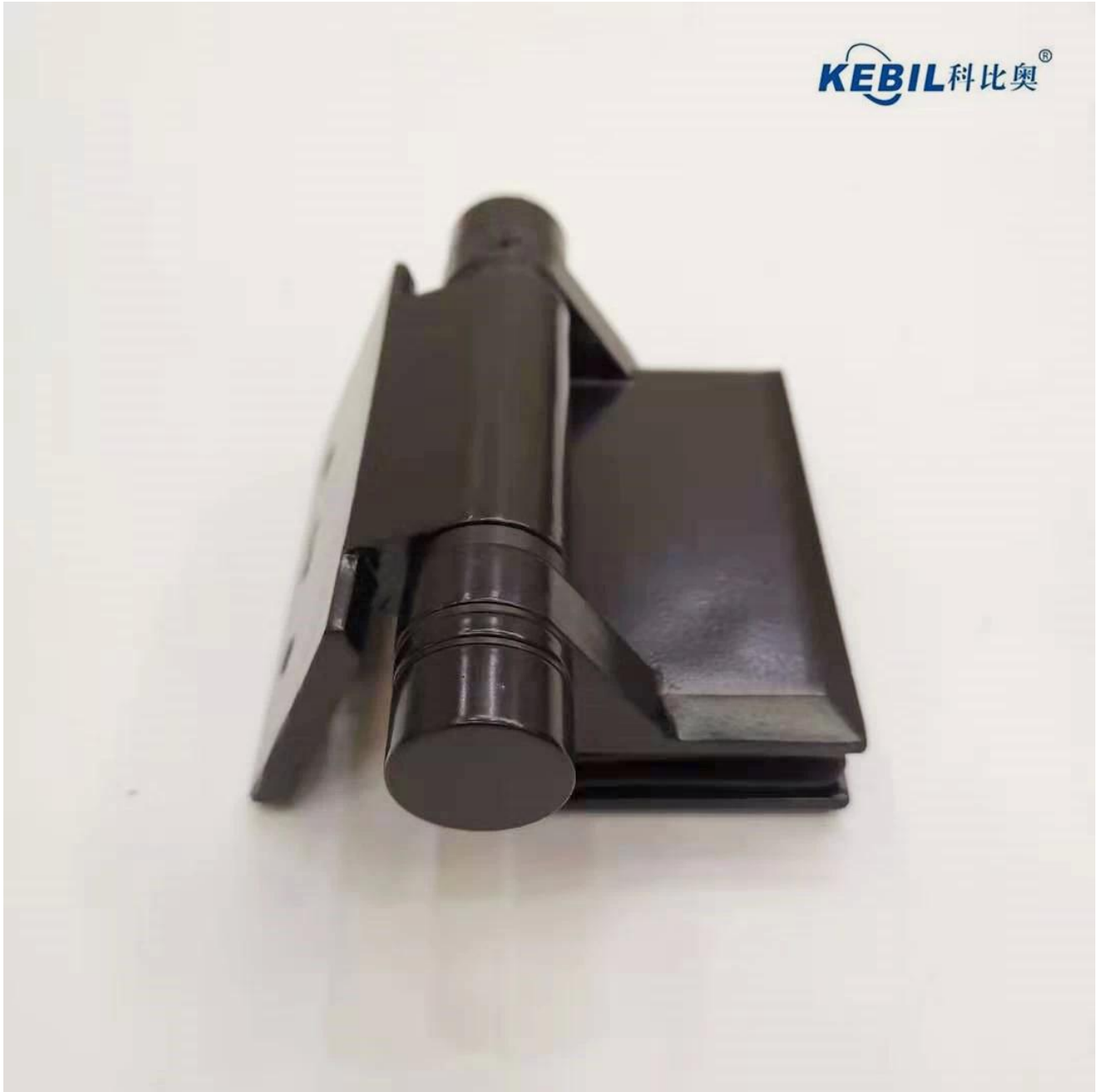
Foto di cerniera vetro , G-R

Cerniera vetro-vetro, con cappuccio conico alle estremità