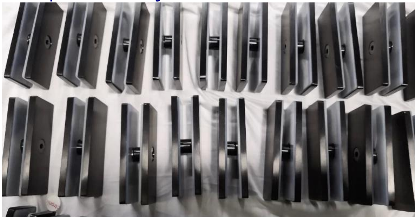
Morsetto in vetro nero a 90 gradi PV-90