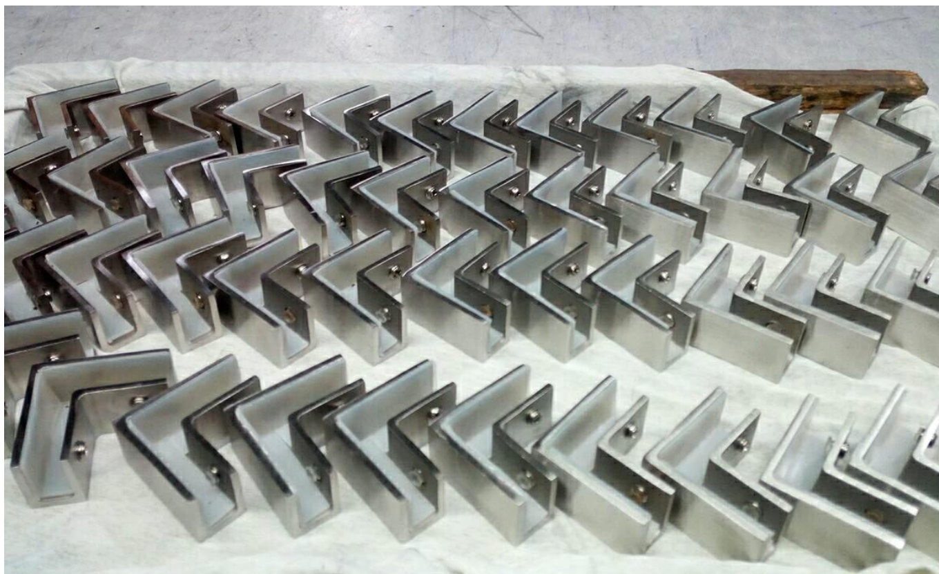
Morsetto per vetro nero a 180 gradi BC-8035