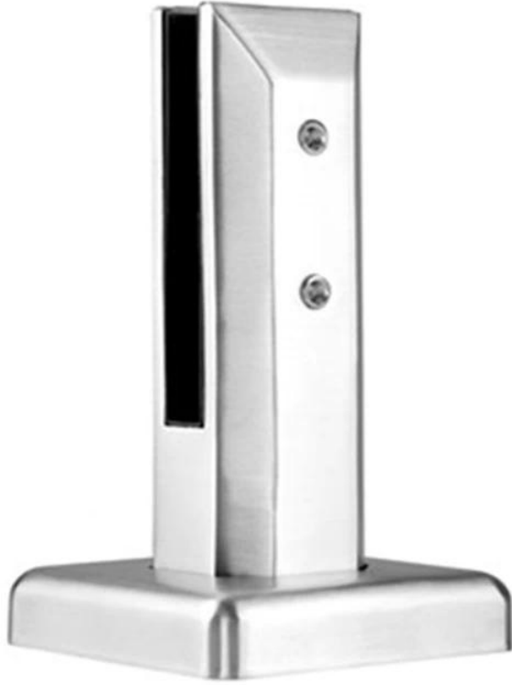
III. Chiaro temperato bicchiere pannelli