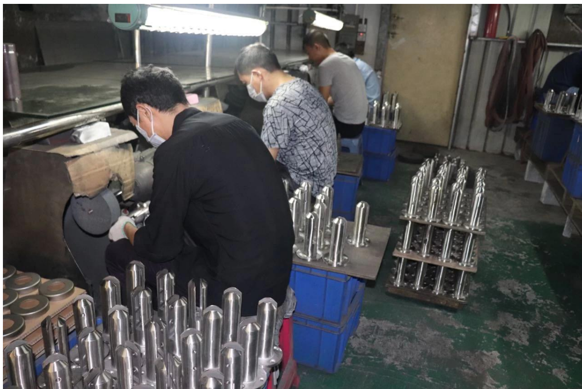
3. Foto del progetto del mini perno in vetro RBM -