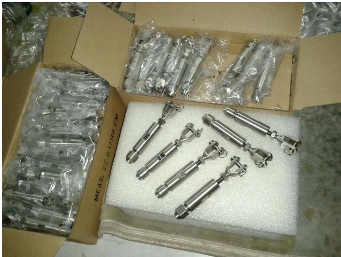
Progetti di ringhiere per cavi