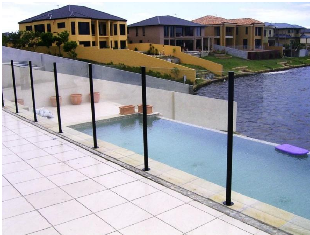
colonna in alluminio quadrata