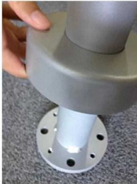
Base targhetta posta corrimano in alluminio, colore silver, in officina