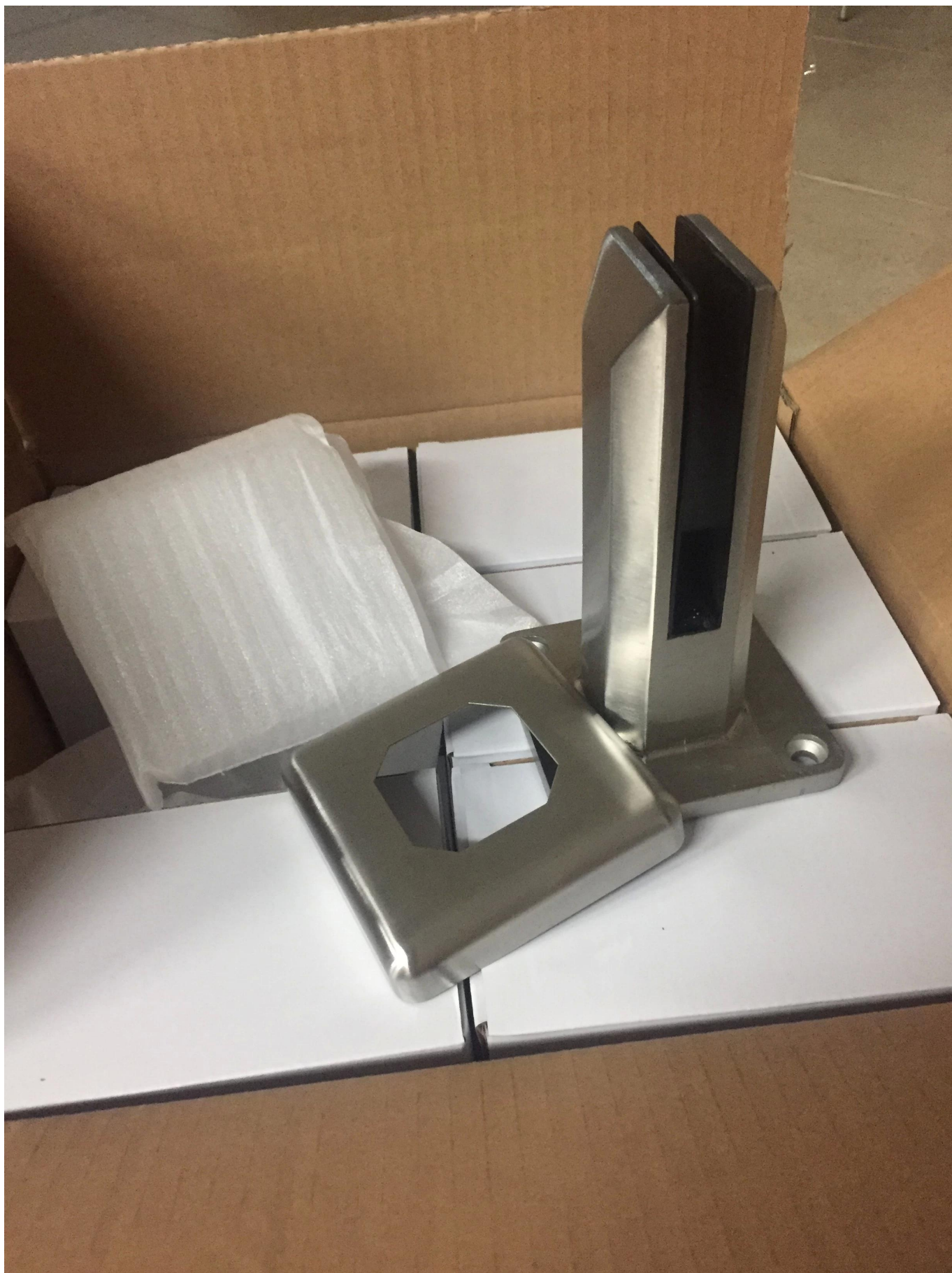
foto installazione senza corrimano