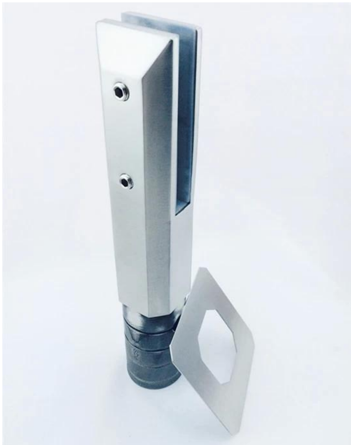
Modello no .: RBM-2(Rotondo piastra di base del perno)