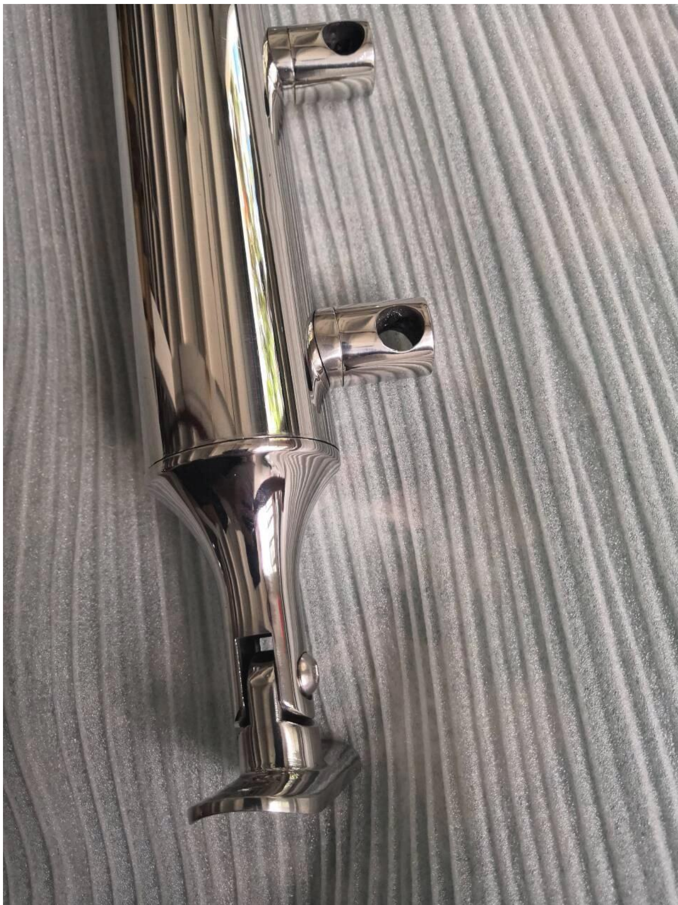
3). Imballaggio di post ringhiera in acciaio inossidabile 316-