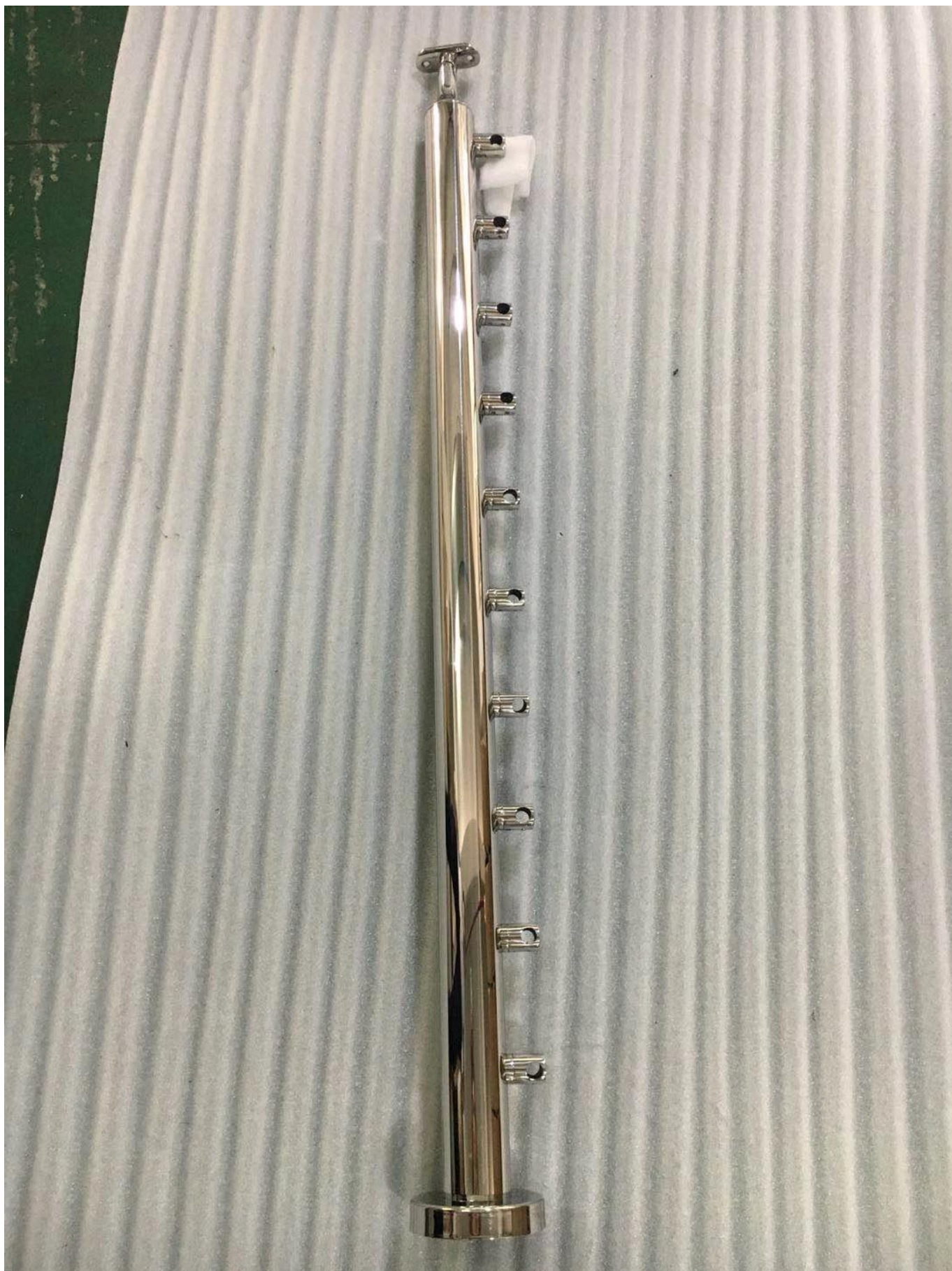
Base per ringhiera in acciaio inossidabile 316 (può essere con o senza base saldata) -