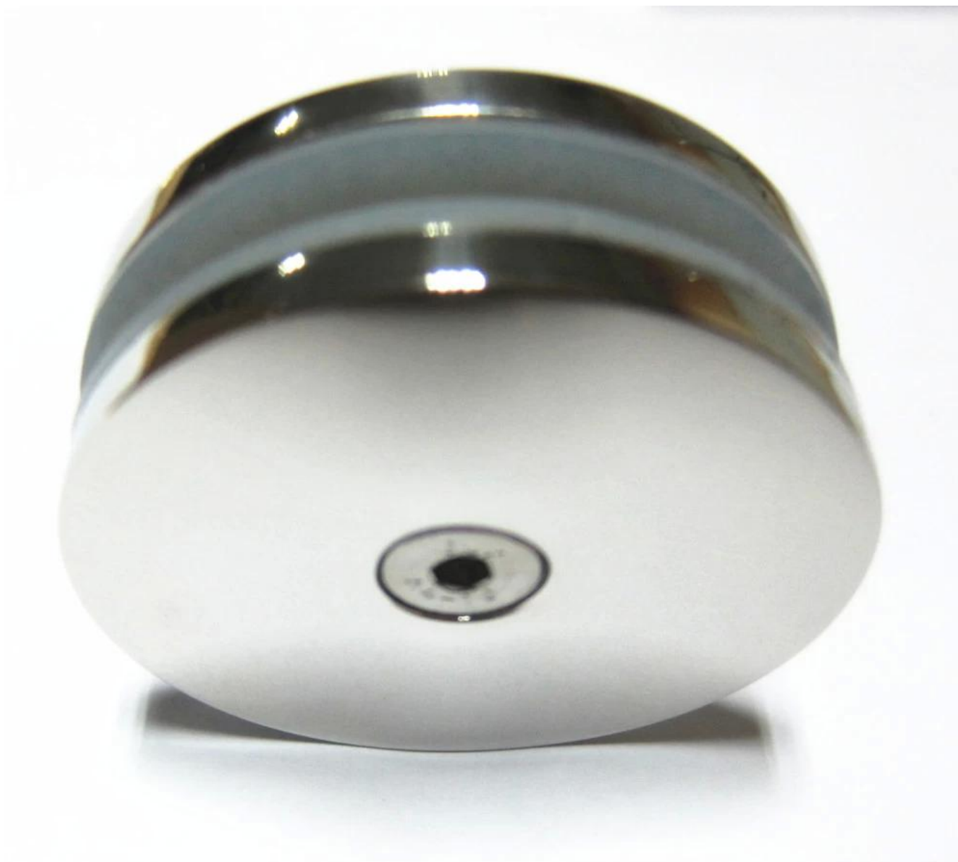
Foto di produzione del morsetto di vetro rotondo da 180 mm con diametro di 60 mm -