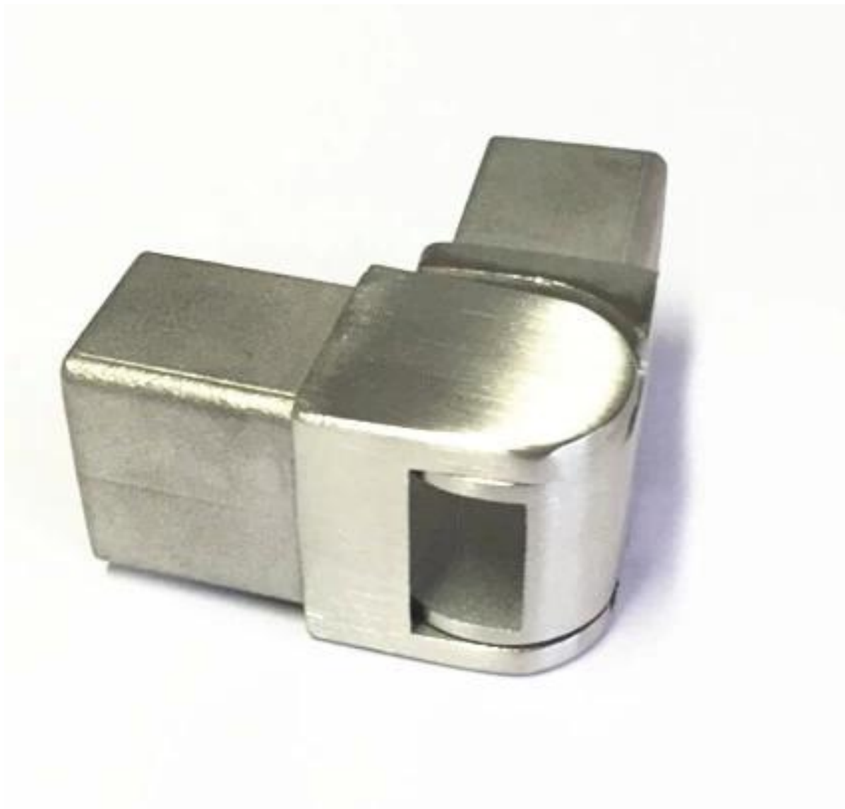
2. Su + Giù snodo regolabile