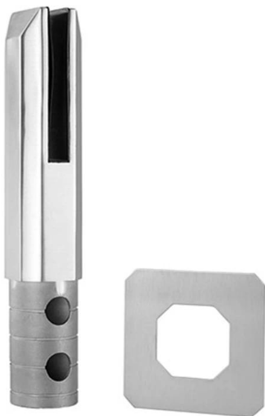
perno di vetro del trapano del centro rotondo