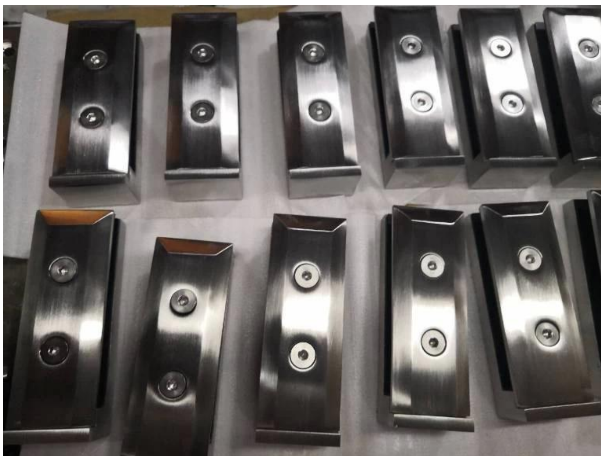
Foto di progetto del perno di vetro per montaggio su fascia -