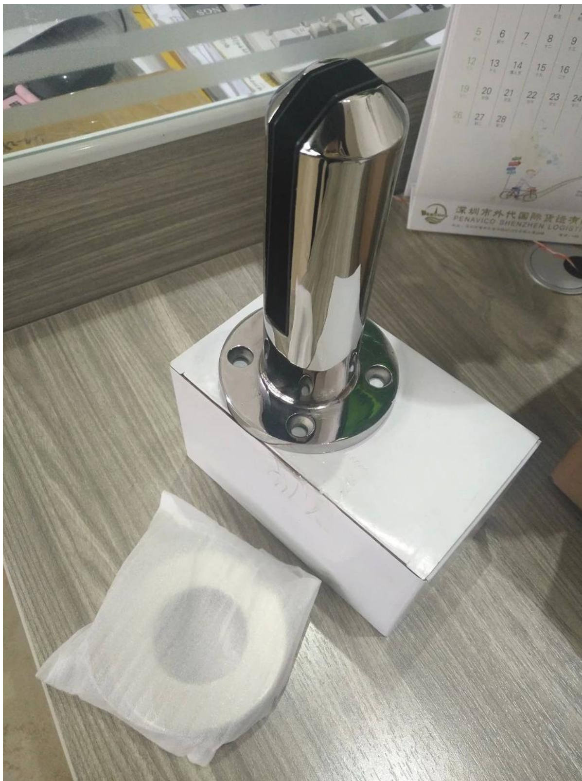
3. Progetto di spigot di vetro per il vostro riferimento.