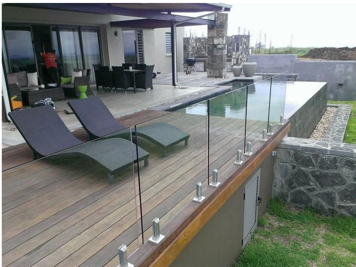
4. 4 tipi rubinetti in acciaio inox,