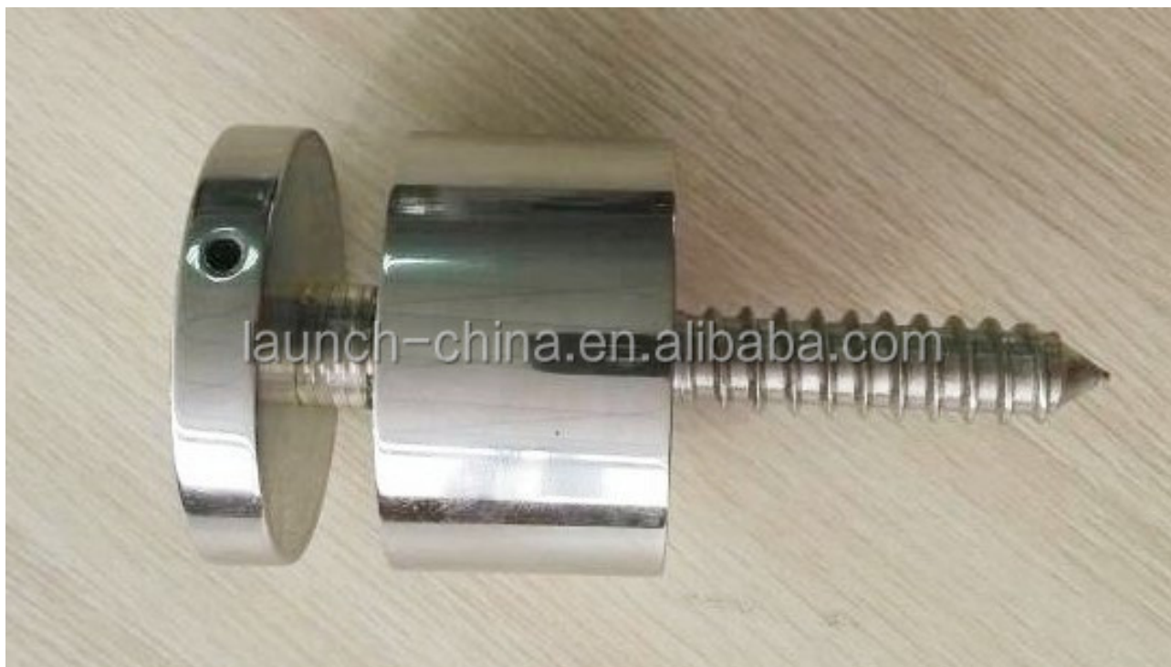
2. Modello No. SF-50 staffe di supporto in vetro.