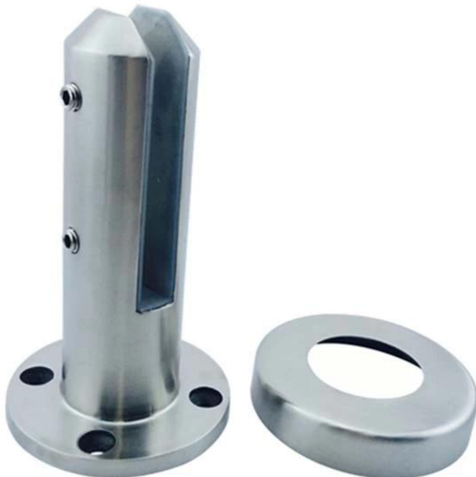
Modello numero.: RCM-2