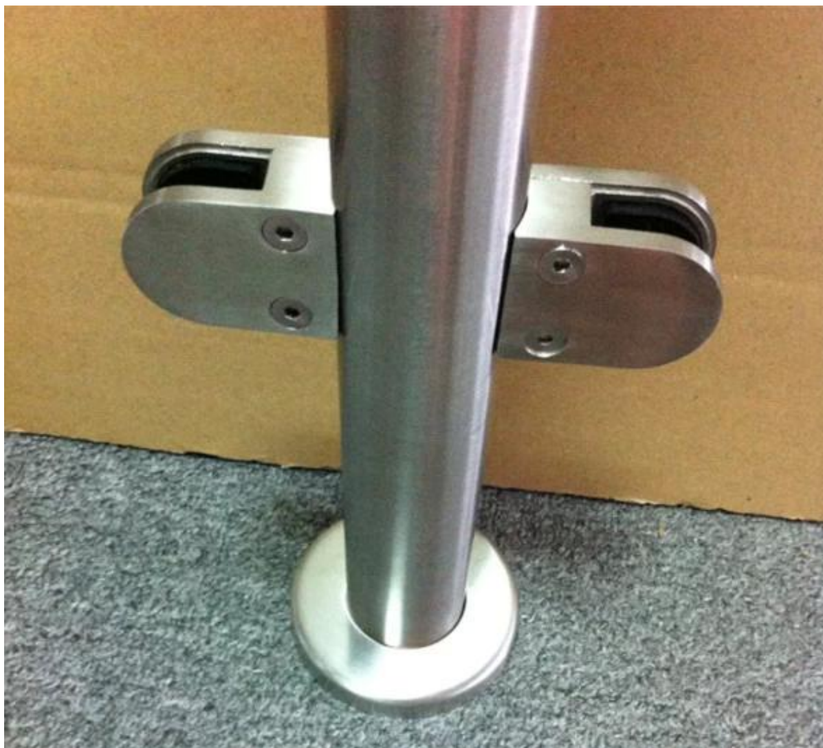
roestvrijstalen gepolijst oppervlak